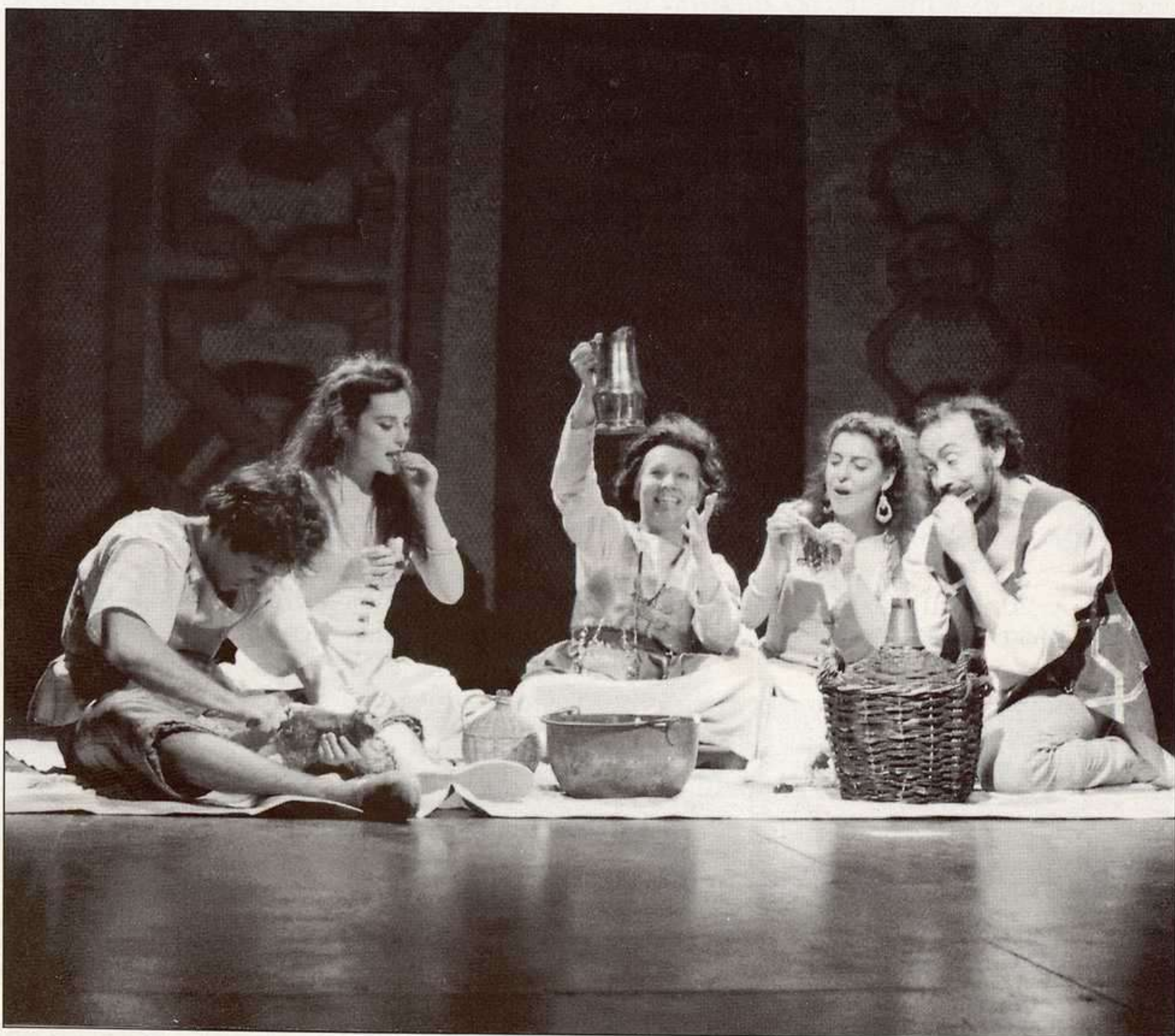
"La Celestina", de F. de Rojas. Dirección: Agustín Iglesias. Guirigai, 1994.

La sociedad de entonces luchaba por vivir con dignidad, es decir, como Dios les daba a entender. Esto suponía conseguir y repartirse recaudos y divertimentos: «Ganemos todos, partamos todos, holguemos todos», dice Celestina, lo que podría conducir a la avaricia: «Ninguna cosa hace al pobre avaro sino la riqueza. ¡Oh dios, y cómo crece la necesidad con la abundancia!», dice Sempronio. Criados, ramerías y rufianas, de alguna forma, engañándose mutuamente, tratan de conseguir cada quien el placer o la riqueza, cuando no ambas cosas. Si bien es posible que la posesión económica posibilite la libertad, esto se traduce a final de cuentas en puro egoísmo, que no es otra cosa que el anhelo por lograr la supervivencia.