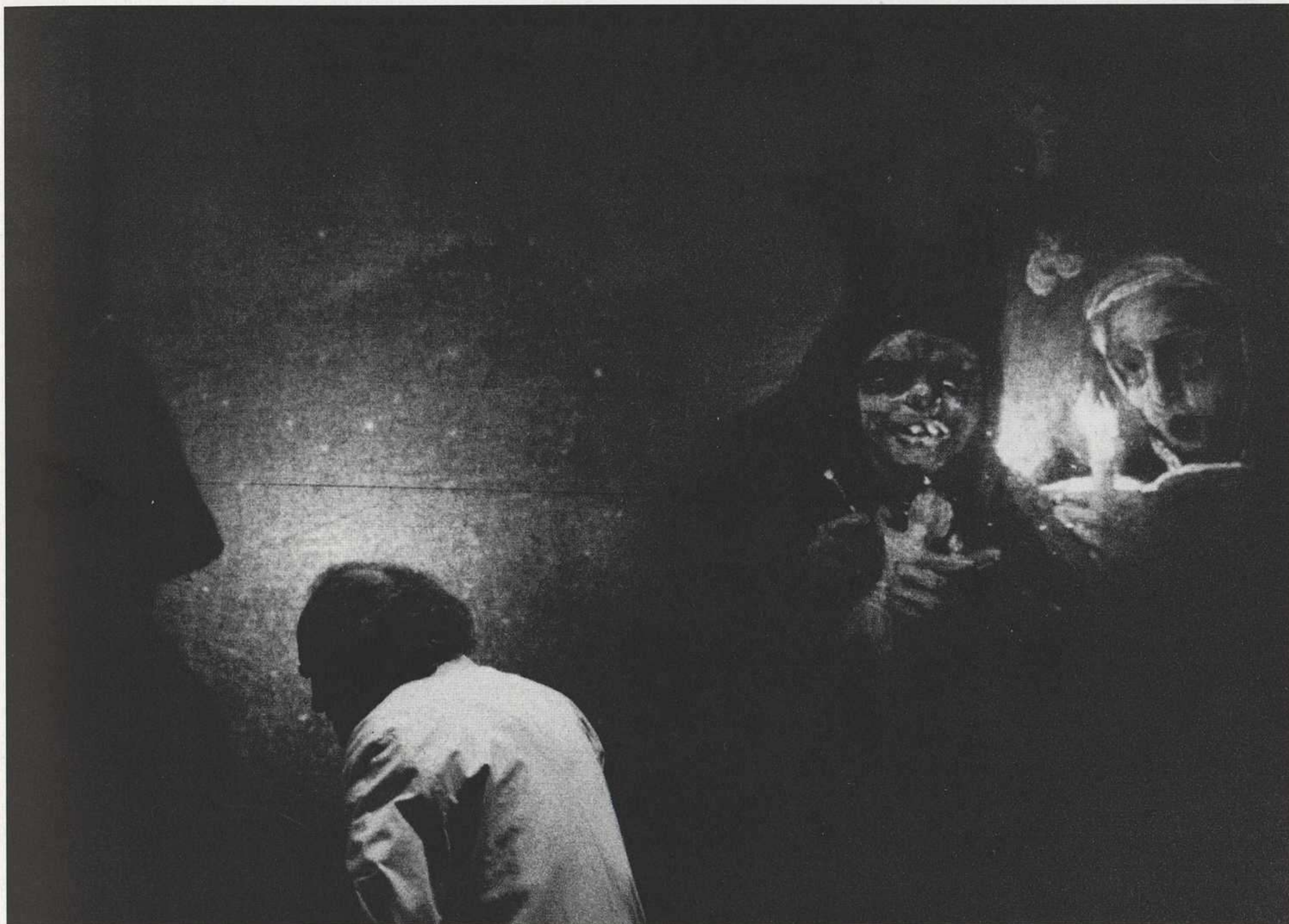
"El sueño de la razón", de A. Buero Vallejo. Dirección: Antoni Tordera. Centre Dramàtic de la Generalitat Valenciana. (1993).

caciones sean un bien o una desdicha para los hombres, pero esa posibilidad sólo se convierte en realidad a través de unas relaciones humanas concretas —relaciones de producción— en una sociedad dada.