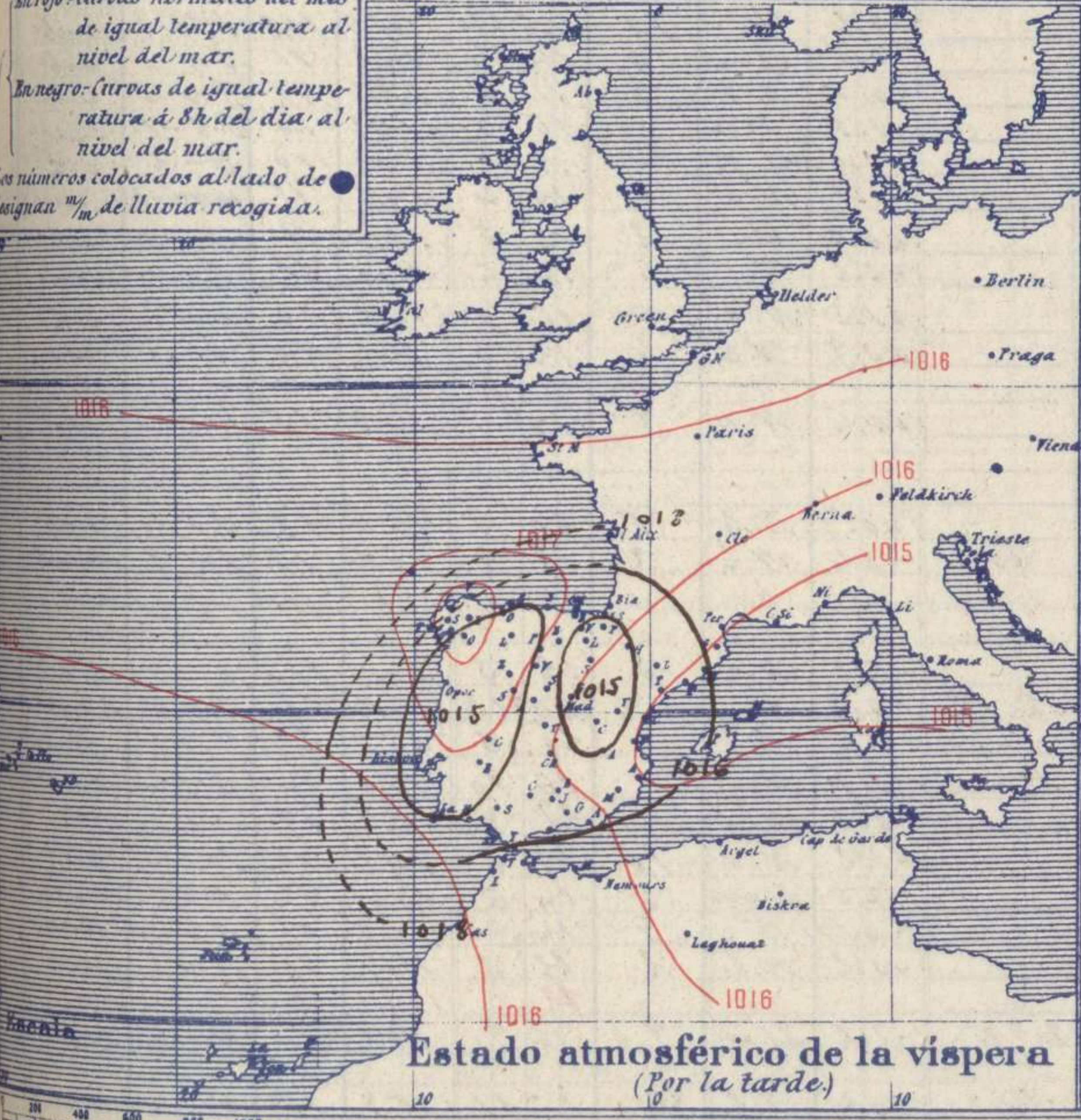
Estado atmosférico de la vispera (Por la tarde.)

En rojo - Curvas normales del mes de igual temperatura al nivel del mar. En negro - Curvas de igual temperatura a 8h del día al nivel del mar. Los números colocados al lado de las designan mm de lluvia recogida.