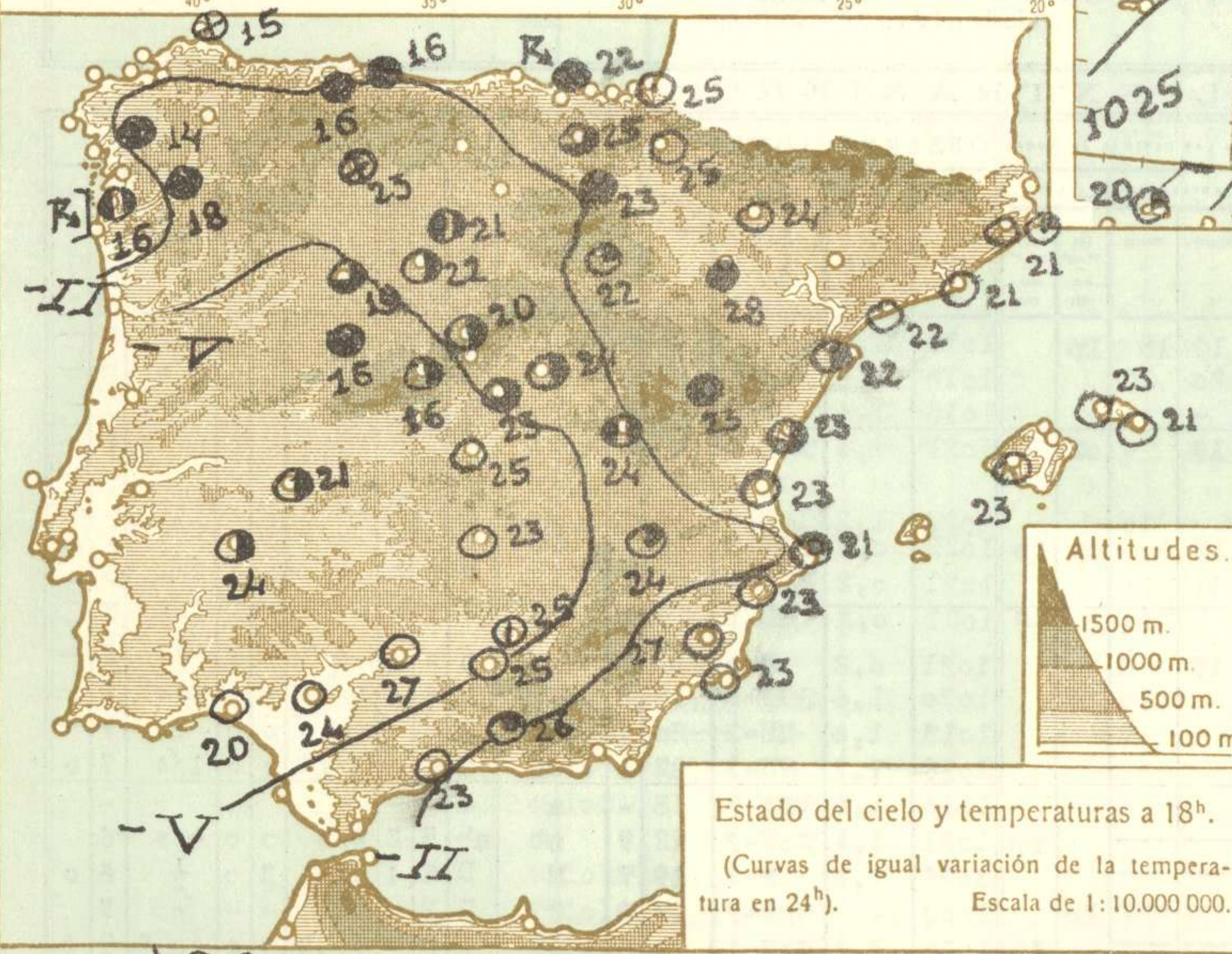
Estado del cielo y temperaturas a 18 h . (Curvas de igual variación de la temperatura en 24 h ). Escala de 1 : 10.000.000.