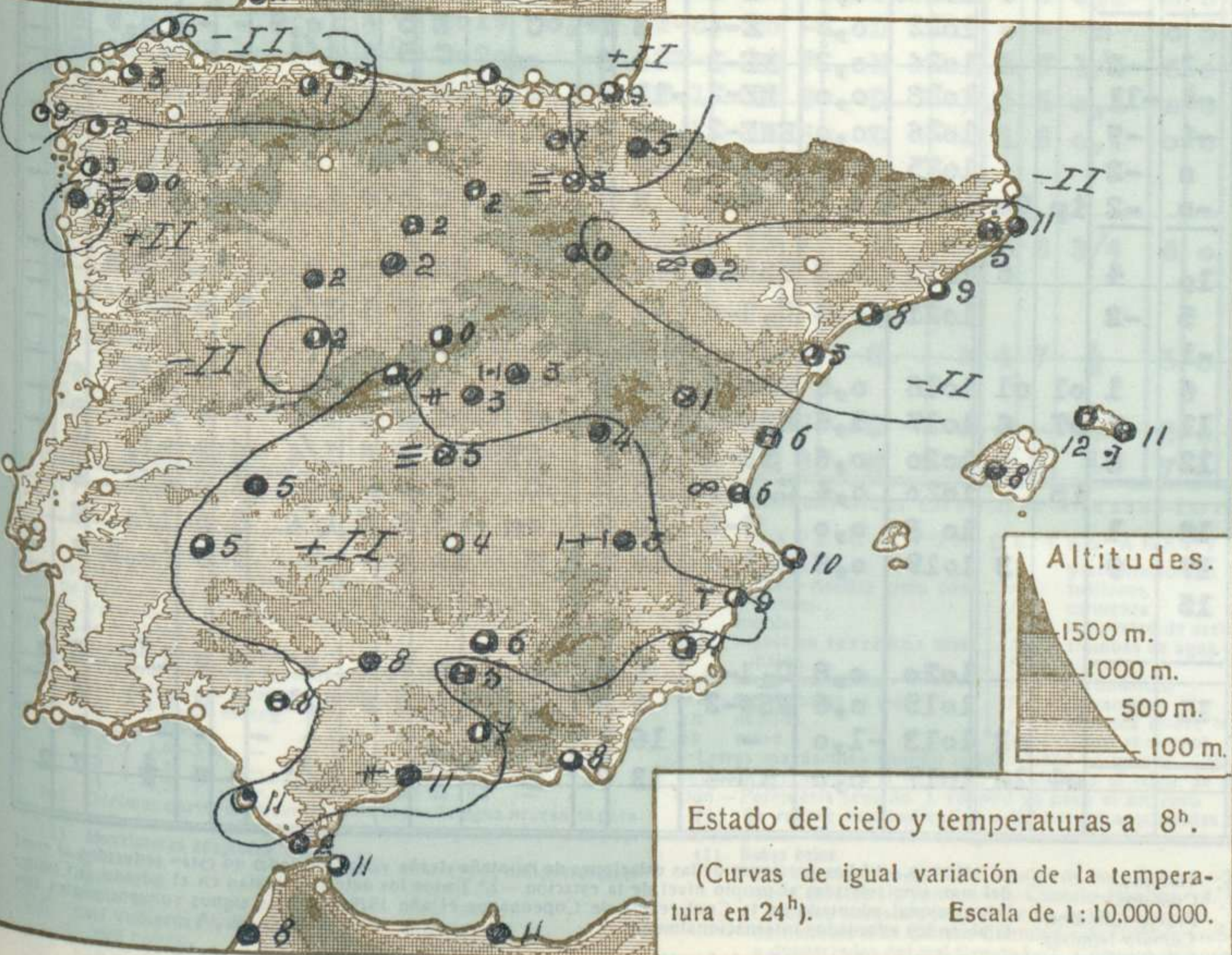
Estado del cielo y temperaturas a 8 h . (Curvas de igual variación de la temperatura en 24 h ). Escala de 1: 10.000.000.