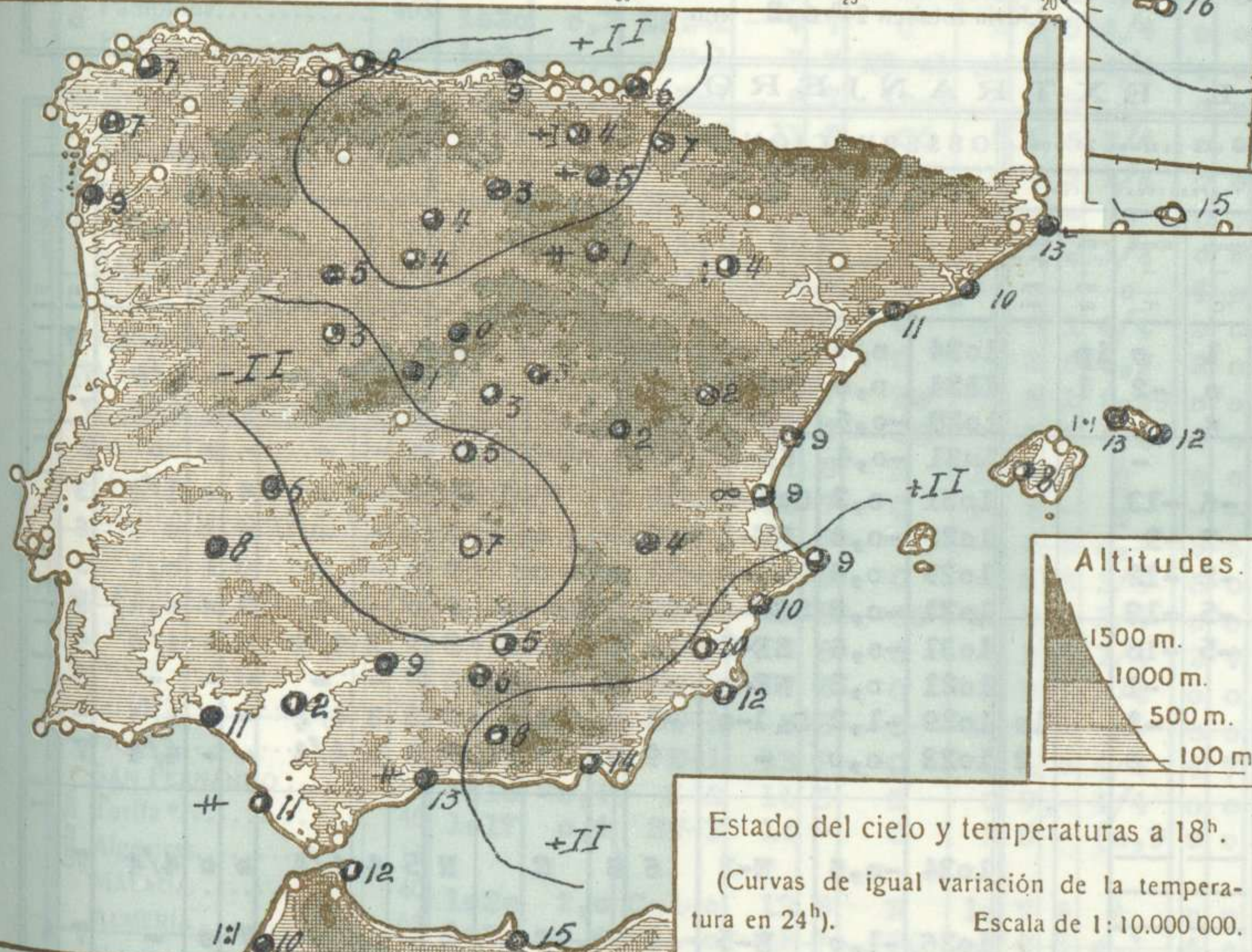
Estado del cielo y temperaturas a 18 h . (Curvas de igual variación de la temperatura en 24 h ). Escala de 1: 10.000.000.