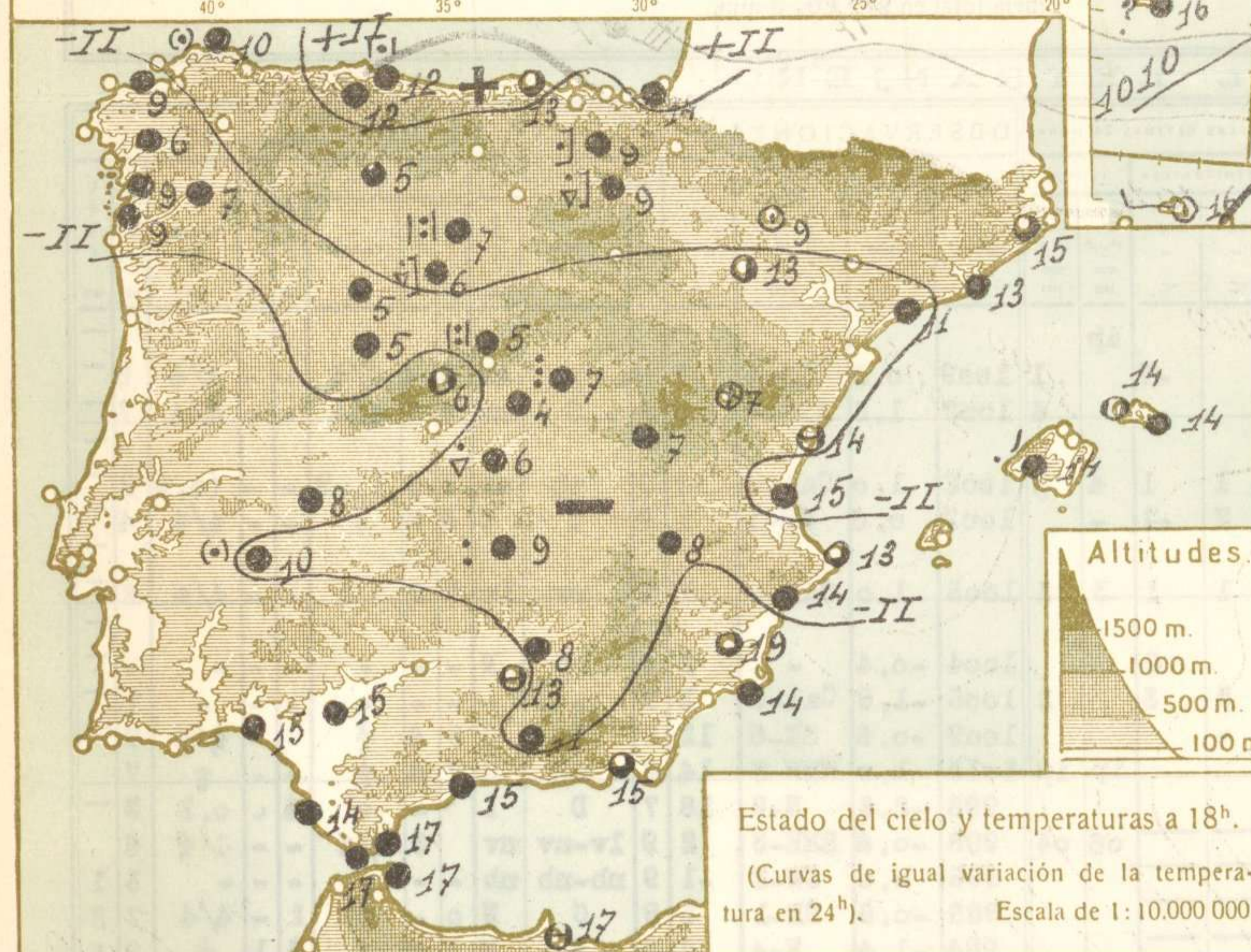
Estado del cielo y temperaturas a 18 h . (Curvas de igual variación de la temperatura en 24 h ). Escala de 1:10.000.000.