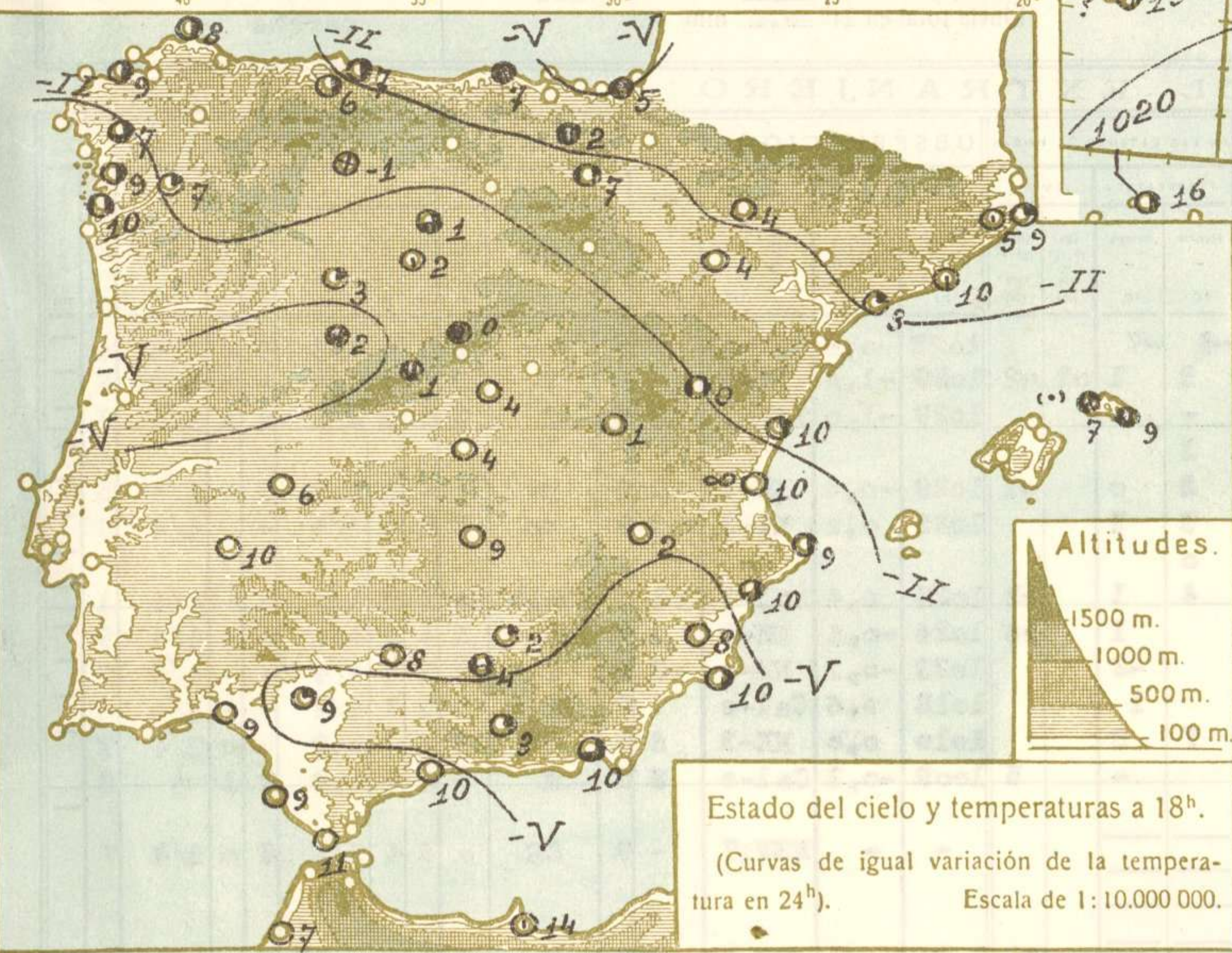
Estado del cielo y temperaturas a 18 h . (Curvas de igual variación de la temperatura en 24 h ). Escala de 1:10.000.000.