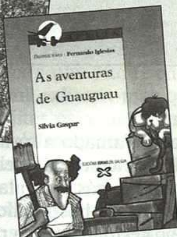
As aventuras de Guaguau Silvia Gaspar