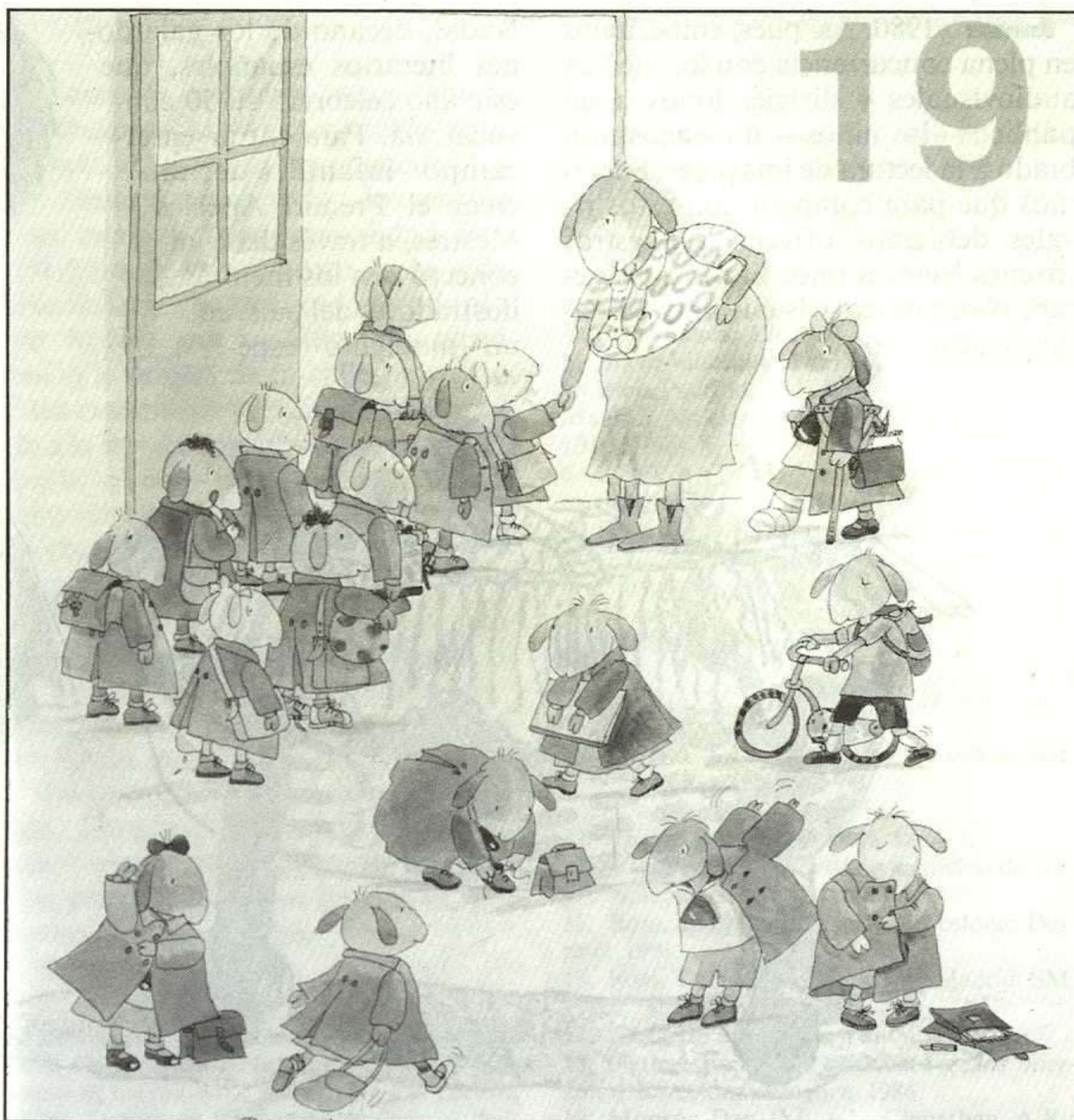
ROSER CAPDEVILA, JUGUEMOS A CONTAR, BARCELONA. DESTINO, 1992.

«Hablemos de...» se propone facilitar el diálogo entre los adultos y los niños sobre temas de la vida cotidiana y situaciones que pueden provocar conflictos. Los textos de María Martínez, psicóloga de gran experiencia, intentan acercar los mundos a veces antagónicos del niño y del adulto. Los 12 títulos publicados hasta el momento no quieren ofrecer soluciones mágicas, sino conseguir algo tan sencii-