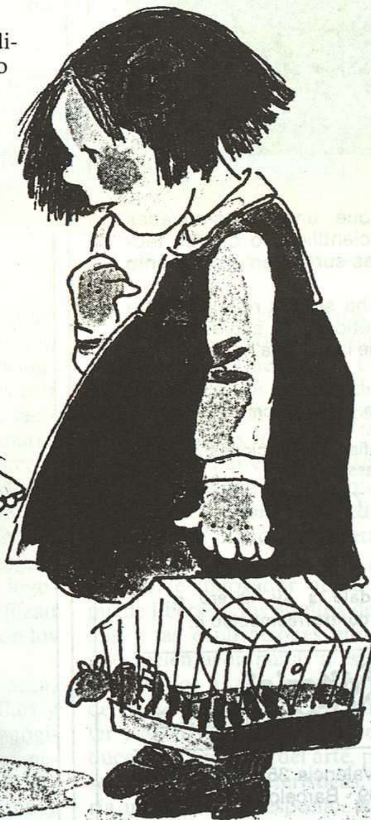
ROSER CAPDEVILA, HABLEMOS DE UNO MÁS, BARCELONA: DESTINO, 1988.

La editorial, de amplia tradición literaria, concede el Premio Nadal, decano de los galardones literarios españoles, que este año celebrará su 50 convocatoria. Para entrar en el campo infantil, decidió crear el Premio Apelles Mestres, a través del cual conectó con los mejores ilustradores del país, en un momento espe-