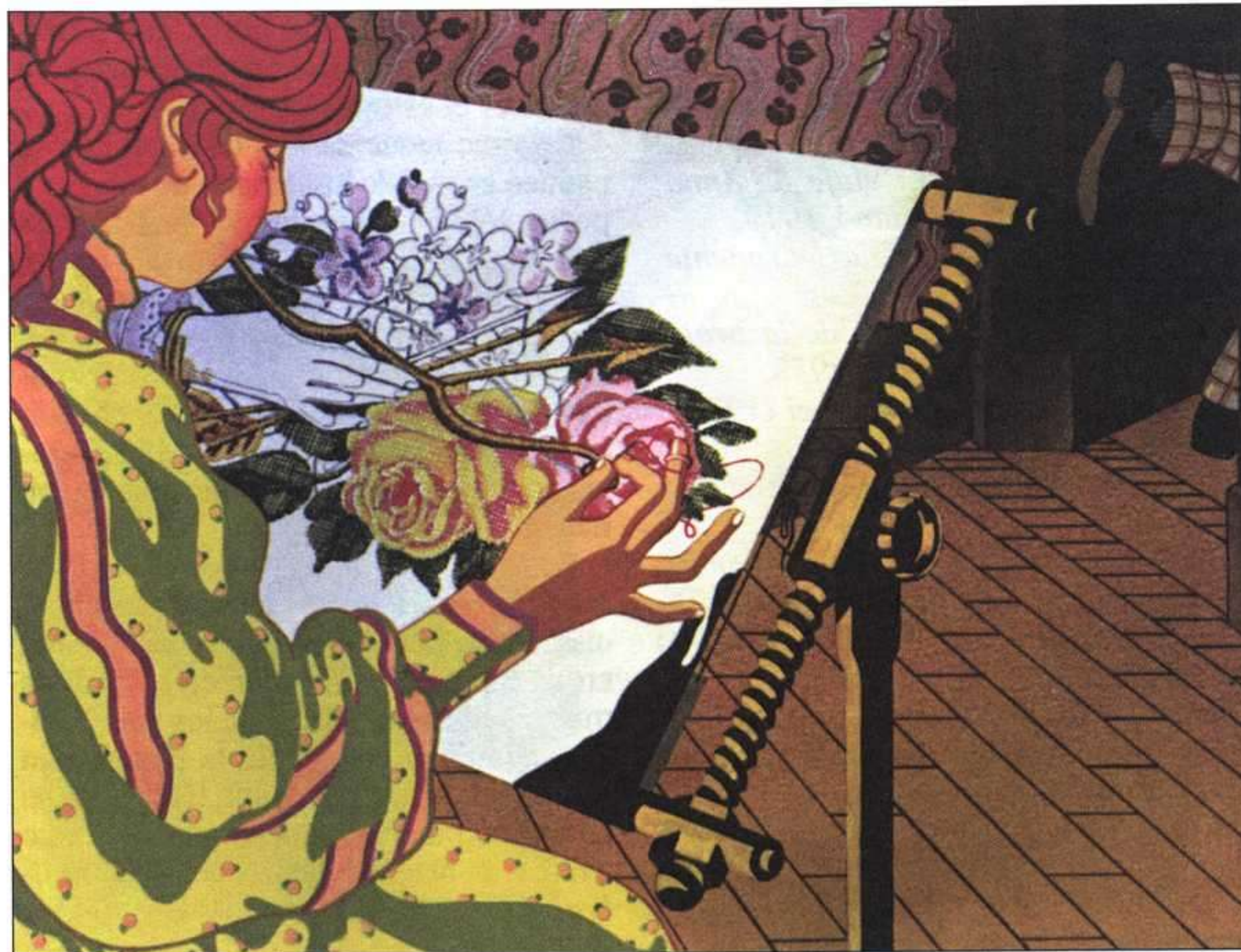
DÉCADA DE LOS 80: NELLA BOSNIA, LA MANO DE MILENA (1982).

ven los monstruos, tuvo una gran importancia, no sólo por el tema de la ilustración, sino porque era la primera vez que en un libro infantil el autor aplicaba las teorías psicoanalíticas sobre la agresividad en los niños pequeños. Lo que ha cambiado, sobre todo, de esa década de los 60-70 con respecto a la de los 90, es que había una preocupación muy clara en los ilustradores —muchos de ellos son autores únicos del texto y de la ilustración— por el receptor, por el niño que iba a leer los libros, y tenían muy en cuenta la manera cómo evolucionaba. De ahí su relación con el psicoanálisis y la psicología. Etienne Delessert, por su parte, colaboró con el psicólogo Jean Piaget en el libro Cómo el ratón descubre el mundo... , en el que se daba una visión de cómo los niños de 6 años perciben lo que son las estrellas, la luna, la lluvia, etc. Era el primer trabajo que hacían conjuntamente un científico y un ilustrador, y es de esos álbumes que abrieron caminos que, por las causas que sea, no se han continuado.