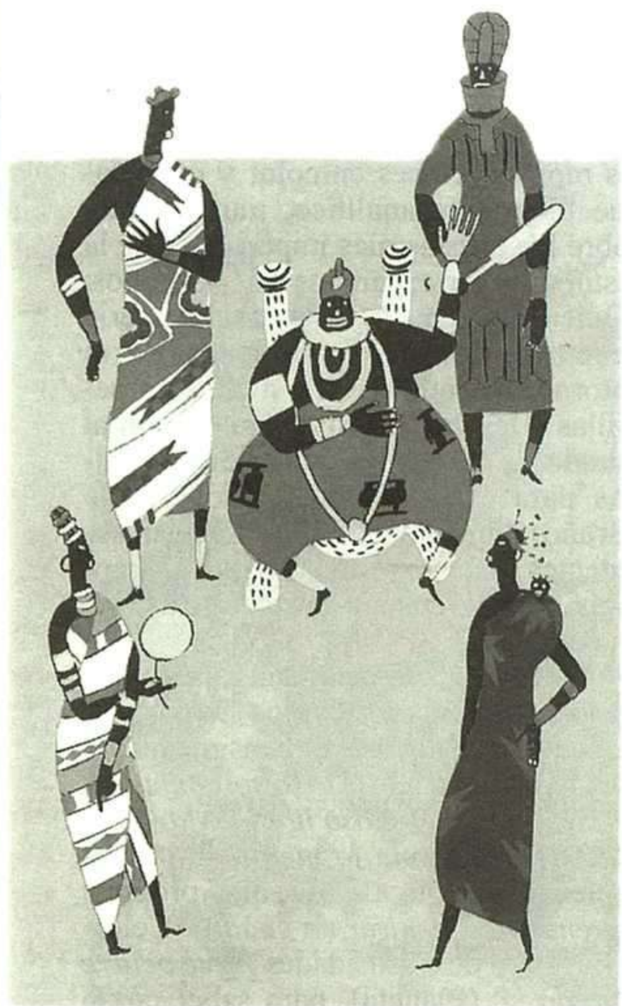
ARNAL BALESTER, MADISÚ, GAVIOTA, 1997.