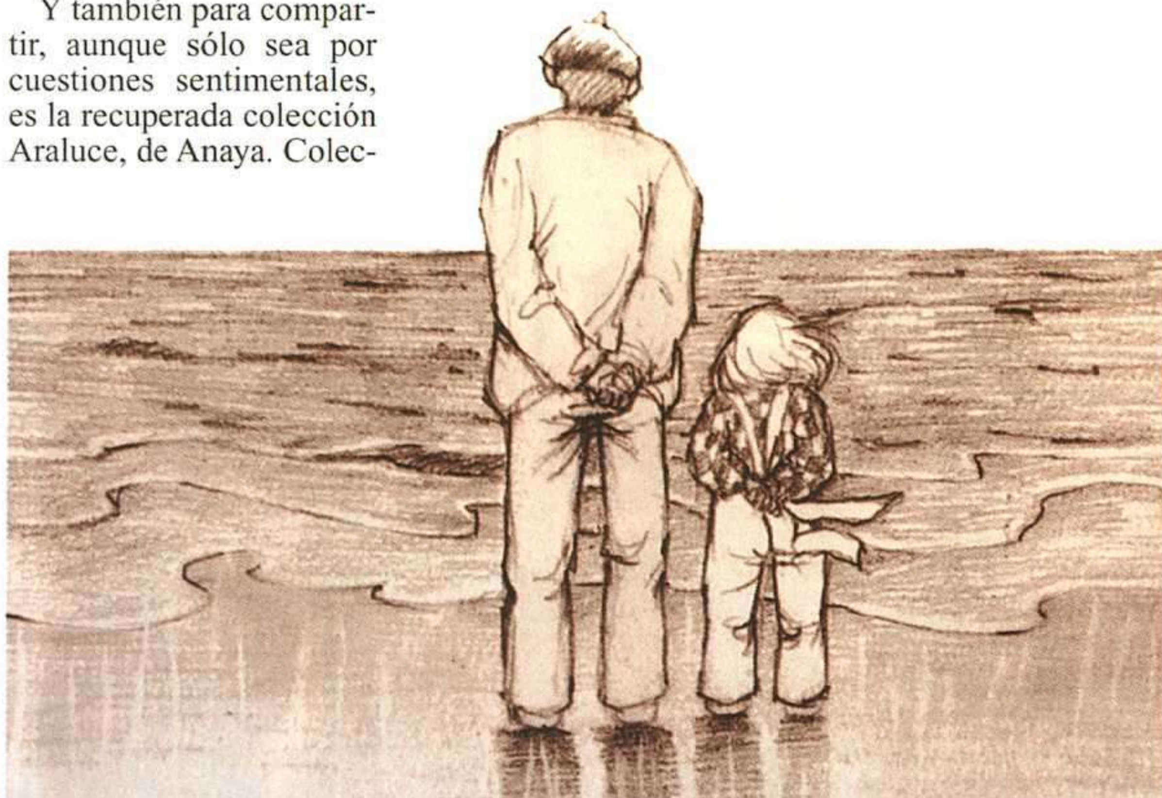
AUCIA CAÑAS, LOS CAMINOS DE LA LUNA, ANAYA, 1997.

Es en esta especialidad donde se advierte una mayor preocupación de los editores por encontrar el tipo de narrativa que satisfaga al lector de 14 años en adelante. Entre otras cosas, porque nadie