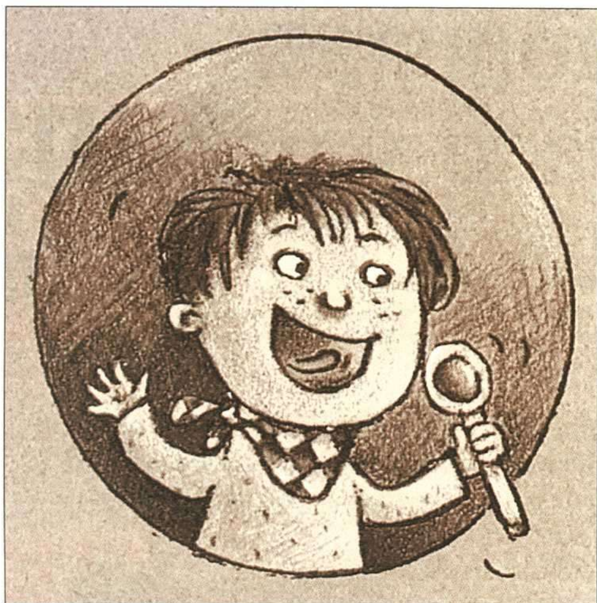
ANNE DECIS, ME DUELE LA LENGUA, EDEBÉ, 1997.