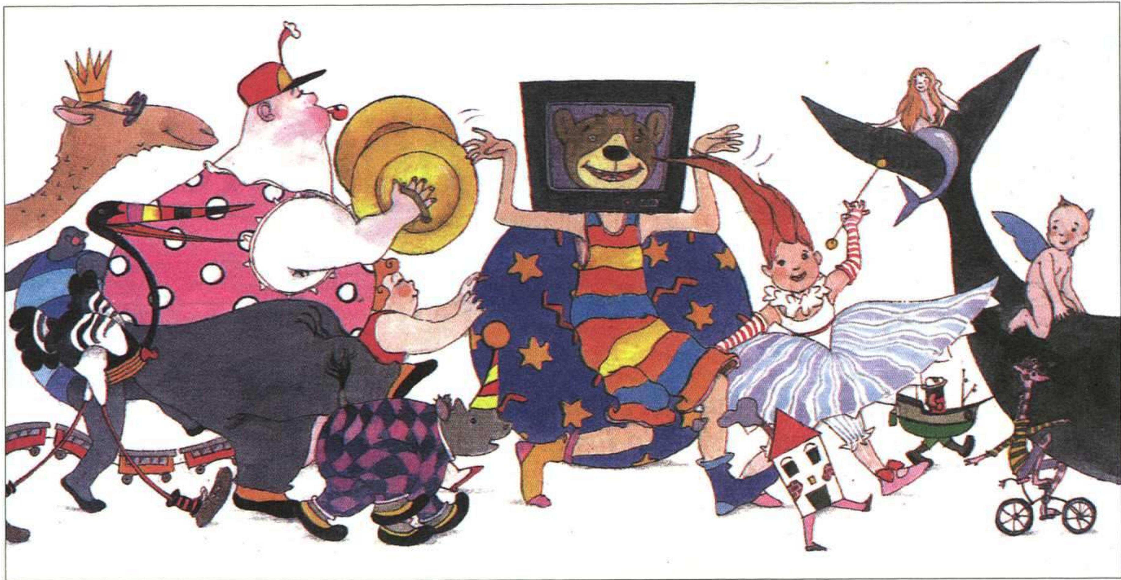
JESÚS GABÁN, DICCIONARIO ESTRAFALARIO, SUSAETA, 1997.

malizó una confederación con la Asociación Profesional de Ilustradores de Madrid (APIM) y la Associació Professional d'Il·lustradors de València (APIV) con el fin de aunar esfuerzos en la defensa de sus intereses. Especial atención mereció este año el cómic, también en Barcelona, con dos exposiciones muy interesantes: «La ciudad y el cómic», organizada por el Centre de Cultura Contemporània de Barcelona (CCCB), y «12 x 21. El cómic en Barcelona. Doce dibujantes para el siglo XXI» (véase CLIJ nº 107).