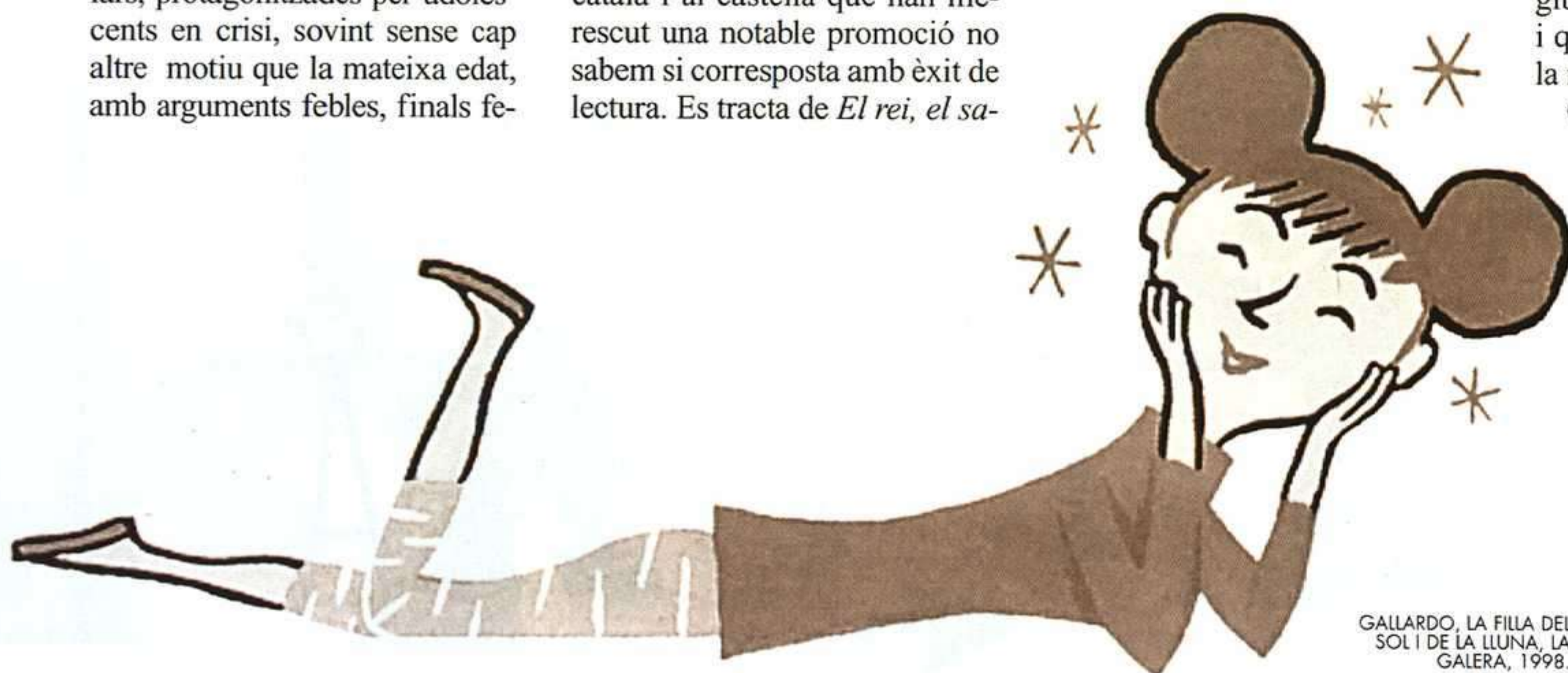
GALLARDO, LA FILLA DEL SOL I DE LA LLUNA, LA GALERA, 1998.

Com veiem, l'edició del llibre infantil en català aquest curs ha continuat amb el seu ritme estable, amb una oferta més àmplia que variada. Malgrat la tendència continuista s'observen novetats que podem consignar com a canvis si es mantenen al llarg de la propera temporada. ■