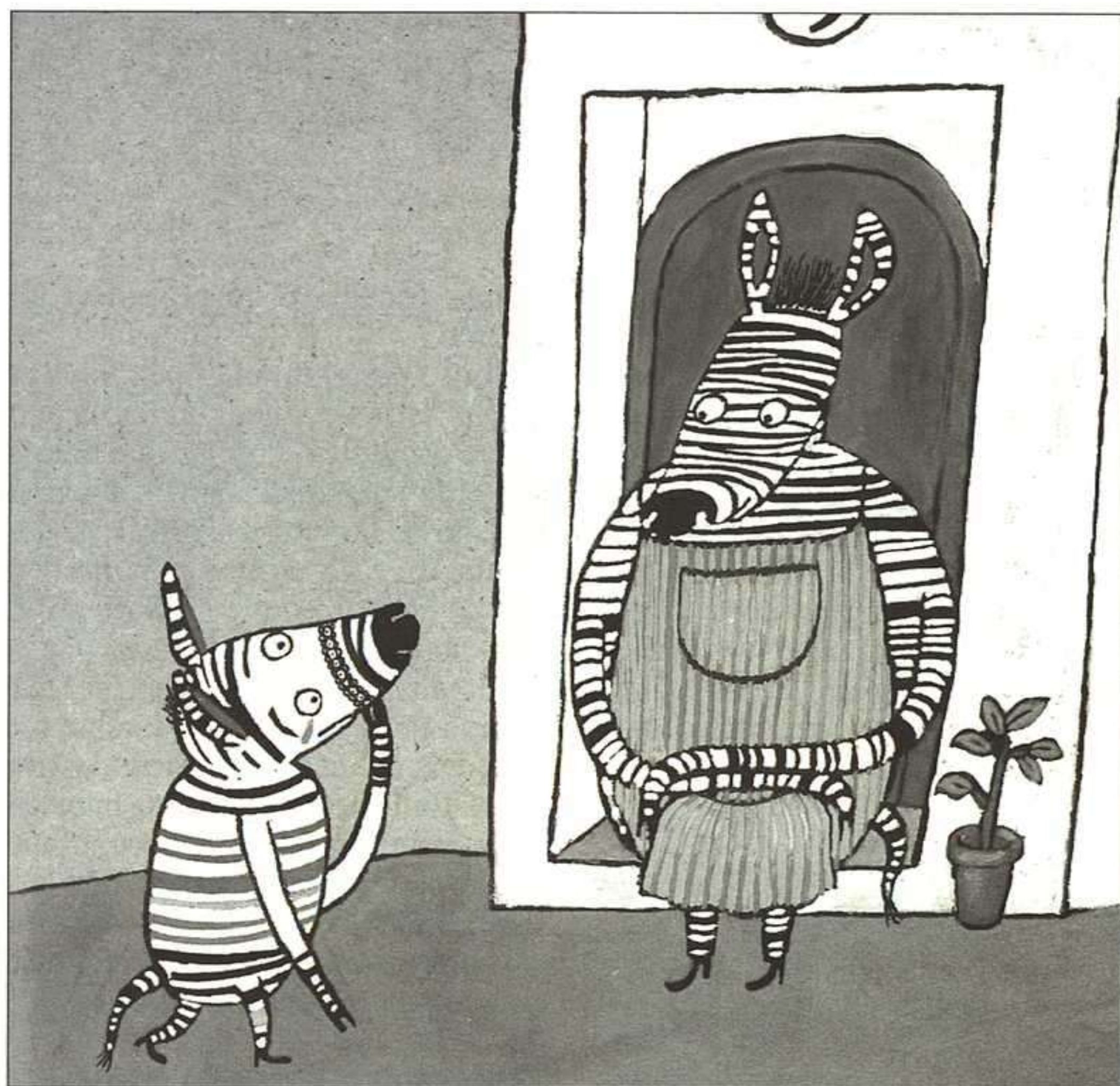
ÓSACR VILLÁN, LA CEBRA CAMILA, KALANDRAKA, 2000.

de lectura. Apuntó también las tendencias conservadoras que prevalecen en este tipo de producto en Galicia, que dividió en dos ejes, uno caracterizado por el didactismo y otro en el que sobresale la utilización de temas transversales como complemento de venta, tales como malos tratos, xenofobia o racismo.