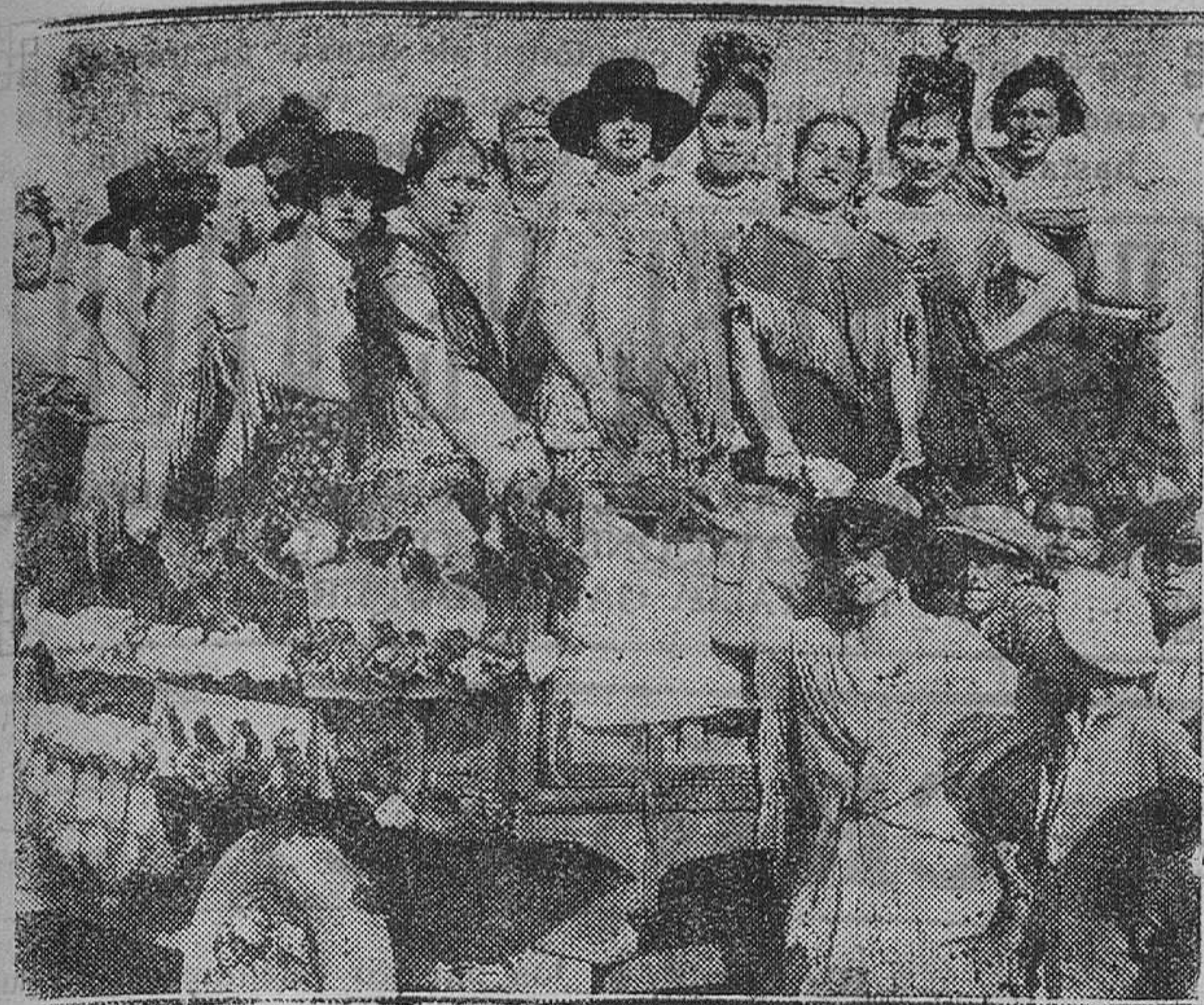
SEVILLA. — La romería de Valme. — Una de las carrozas adornada con flores y ocupada por bellas muchachas