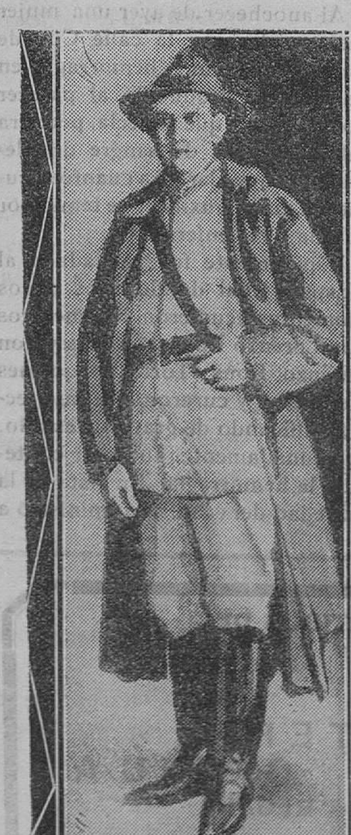
BRASIL.—El coronel Osvaldo Aranbra, uno de los jefes revolucionarios brasileños