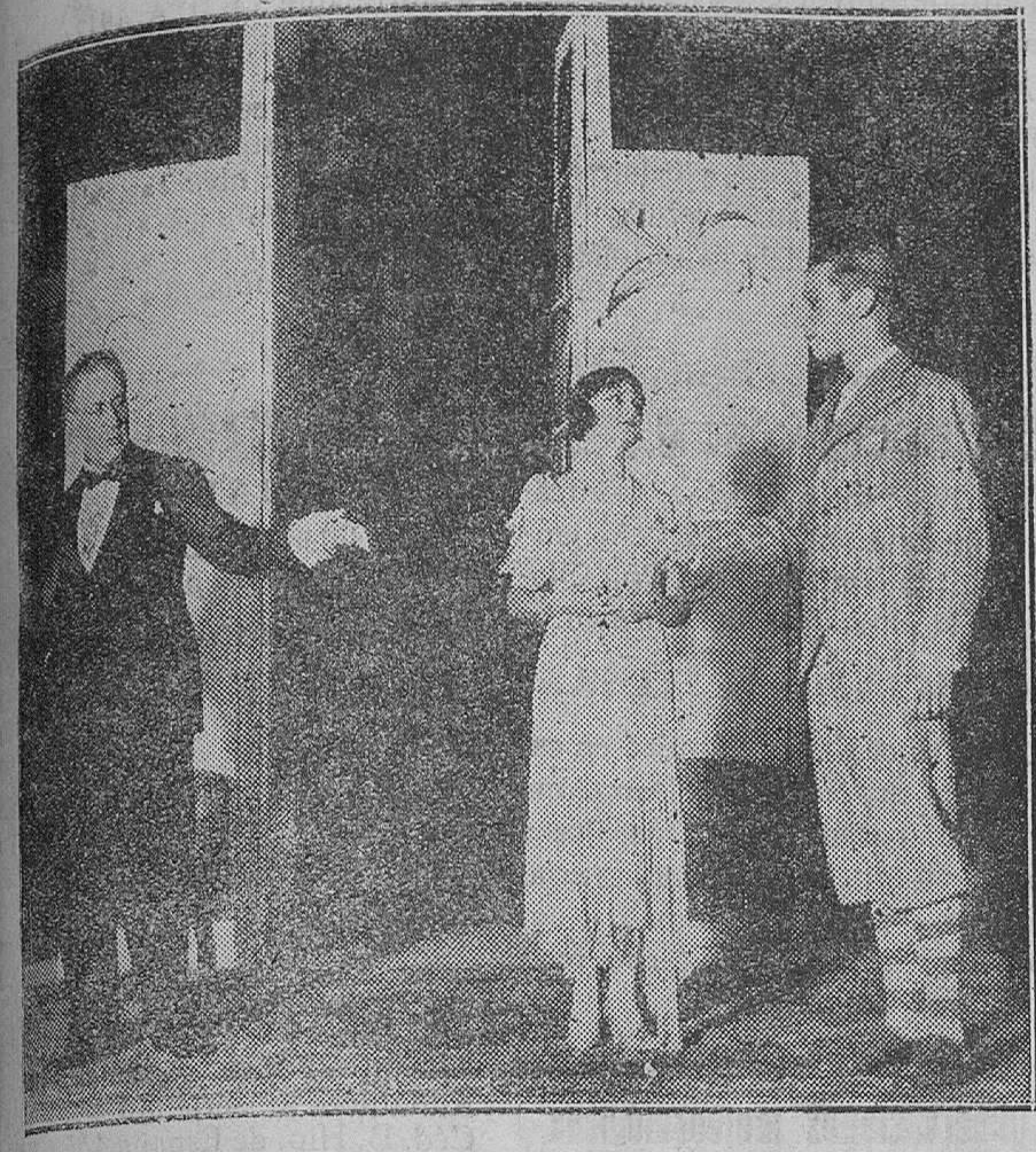
MADRID.—Teatro Pavón.—Una escena de «El extraordinario caso del fiscal Freeman» obra estrenada en dicho Teatro