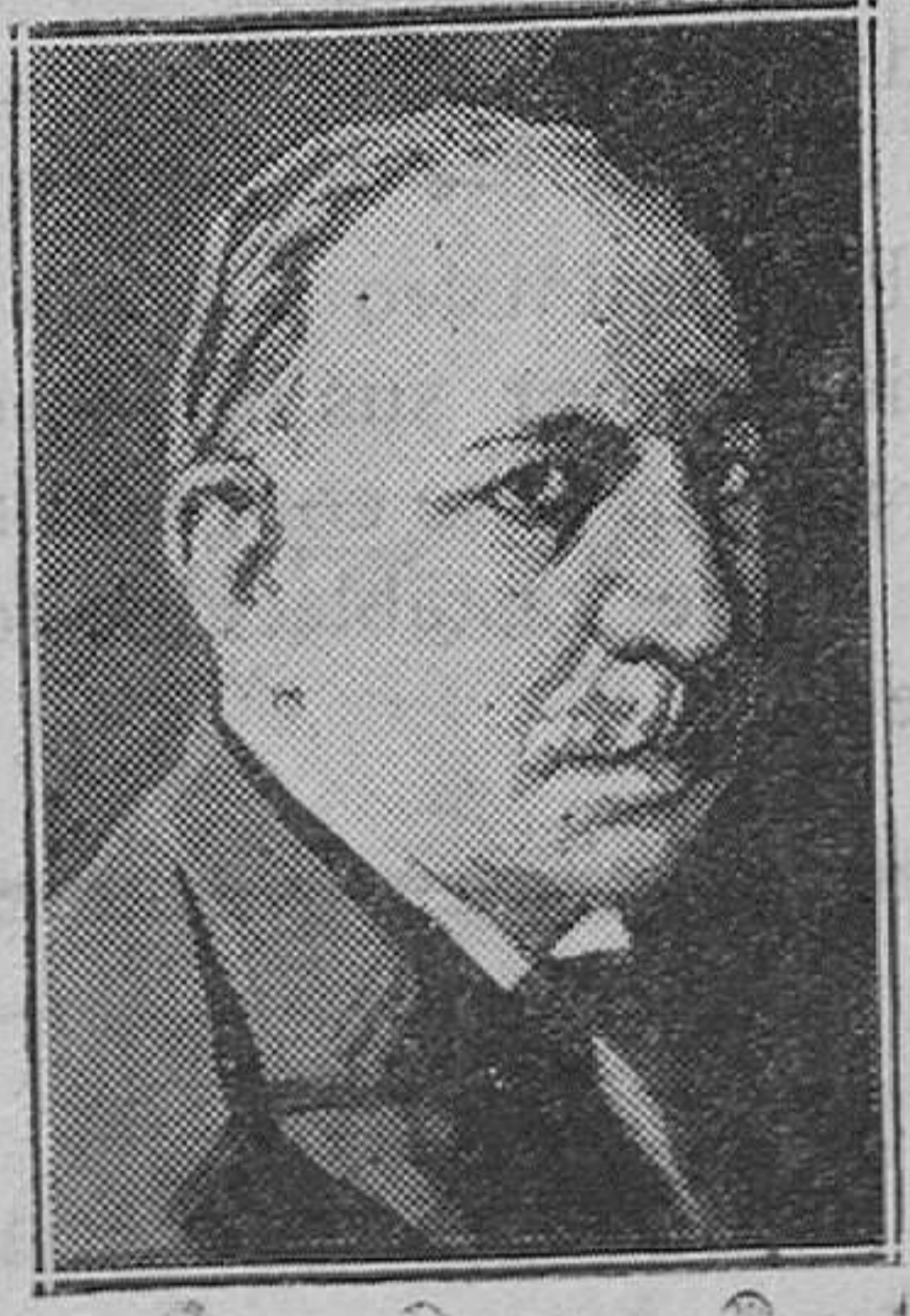
EXTRANJERO.—M. Alvarez de Toledo, ministro de la Argentina en París, que presentó su dimisión

Lógica es la actitud de defensa que parece adoptarían varias naciones, entre ellas la primer interesada Inglaterra, para combatir esta nueva modalidad de la lucha soviética en la ya compleja cues. Un económica de Europa.