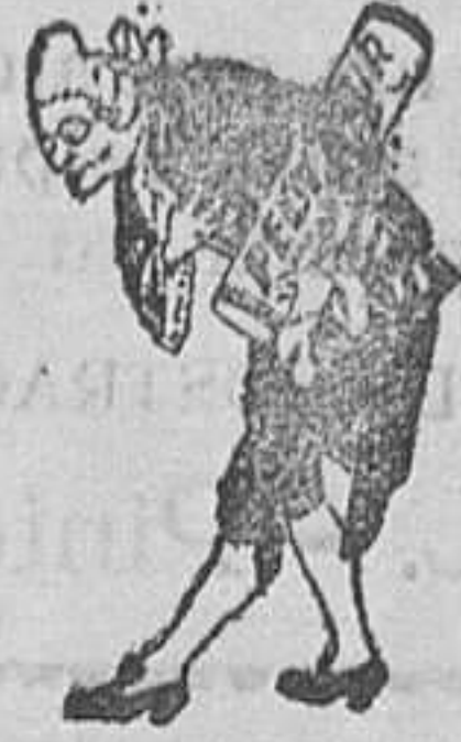
A los pies de Vd.

De venta en todas las Farmacias, Droguerías, y en los Laboratorios Botánicos y Marinos, Ronda Universidad, 6, Barcelona; y Peligros, 9, entresuelo, derecha, Madrid.