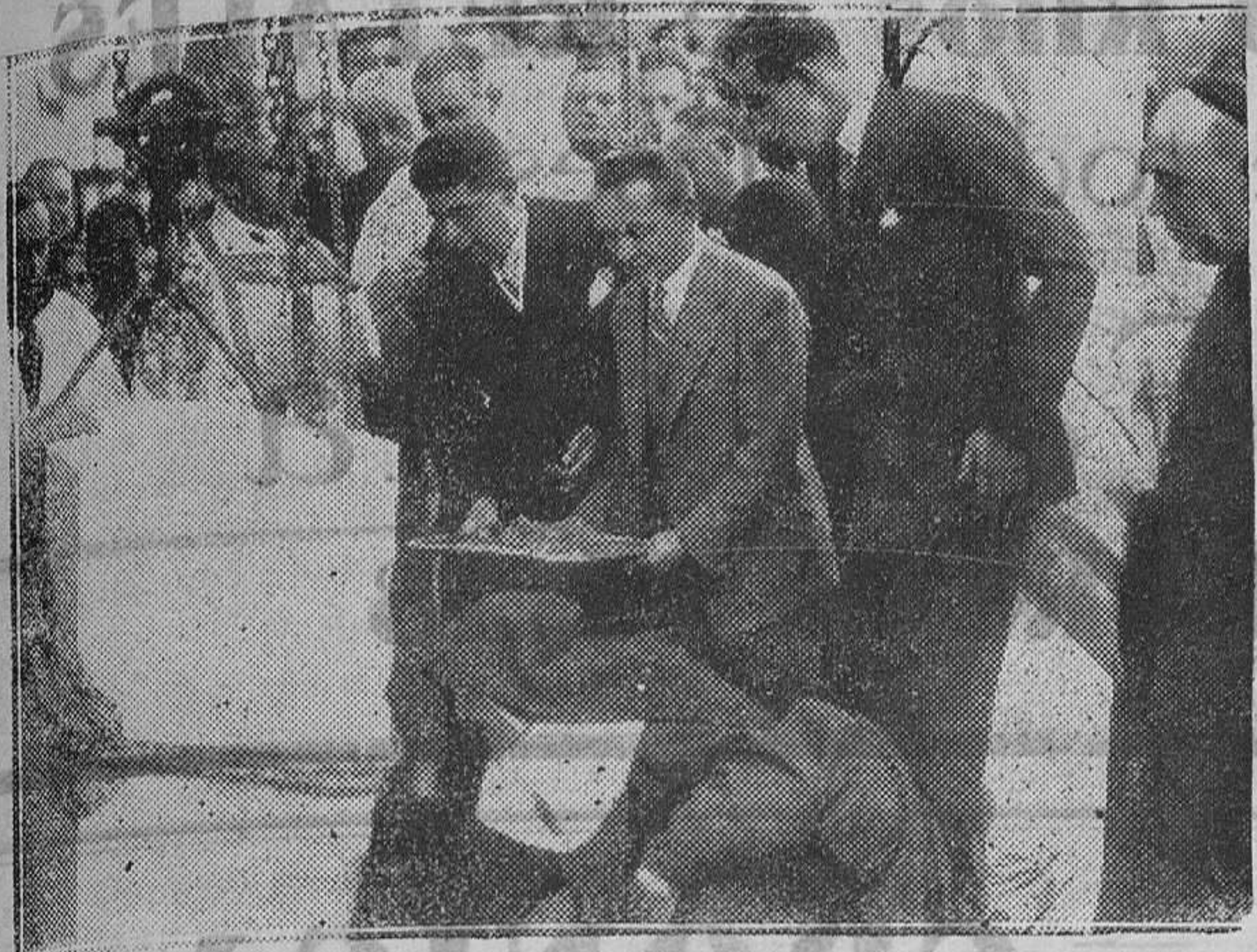
MADRID.—Colocación de la primera piedra del pabellón para niños del Colegio de la Purísima Concepción, con asistencia del Infante Don Jaime y otras personalidades