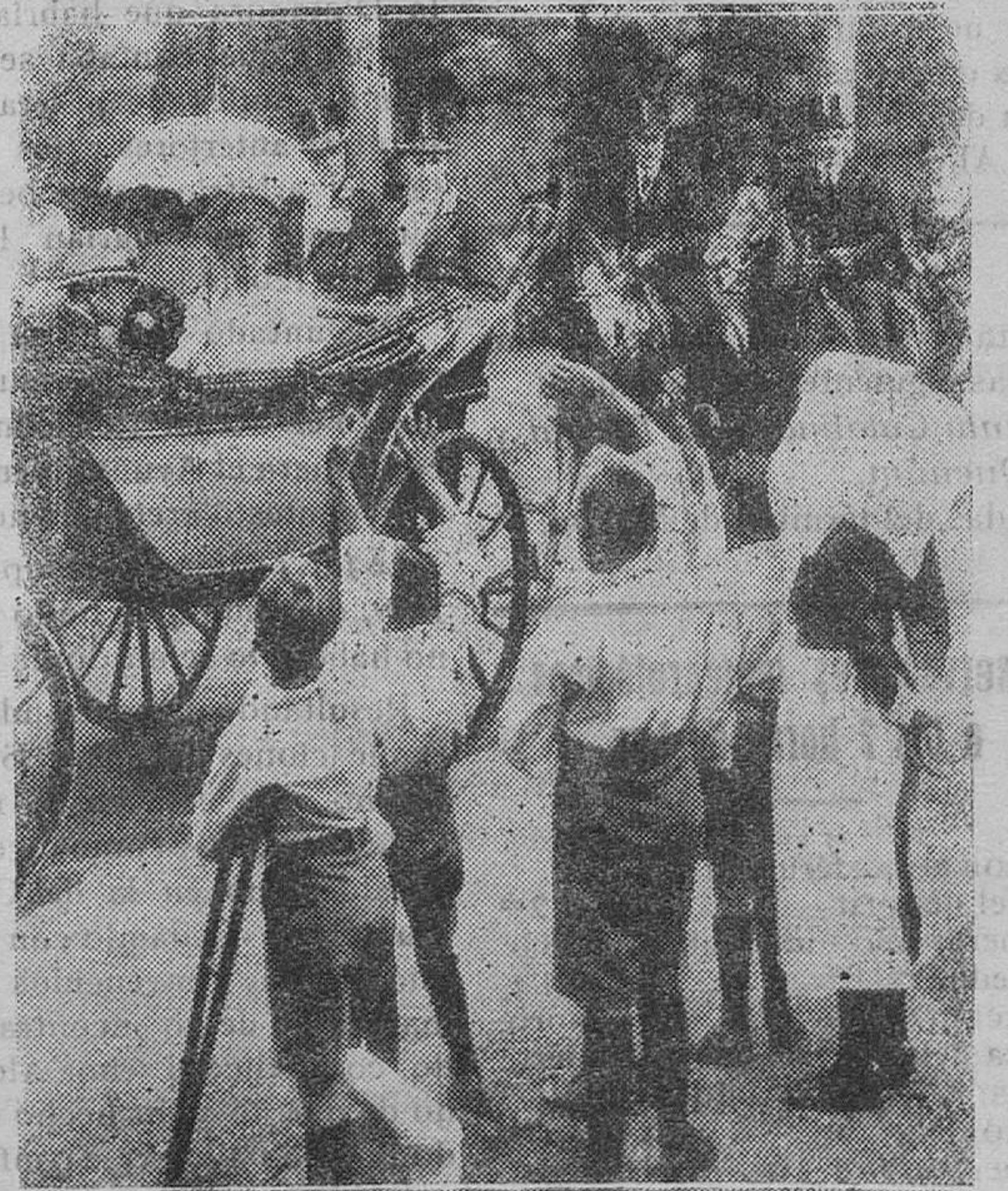
EXTRANJERO.—«Royal Ascot» es la carrera de caballos más importante de Inglaterra, después del Derby. En la foto, la Reina María y el Príncipe de Gales, trasladándose al Hipódromo, corresponden a los saludos de los enfermitos del Hospital de Ascot