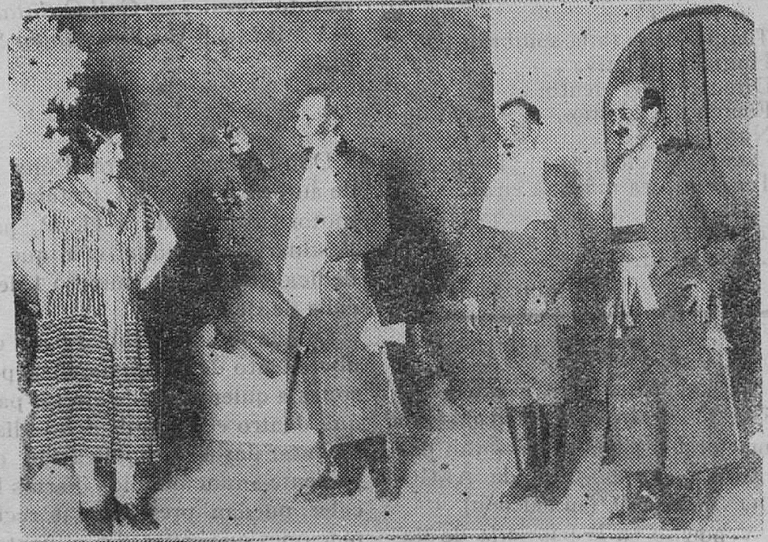
TEATRO CALDERÓN.—Una escena de la zarzuela «María la Tempranica»

Estamos ya, como vulgarmente suele decirse, al cabo de la calle respecto a la génesis del movimiento que partiendo de Sevilla, ha tenido del 25 al 30 del actual mes de junio repercusiones más o menos débiles por toda Andalucía. La orden del paro vino del extranjero, sin que se permitiera a las asociaciones obreras extremistas, que sirven de lazo de unión con la Tercera Internacional, discutir siquiera su oportunidad y conveniencia;