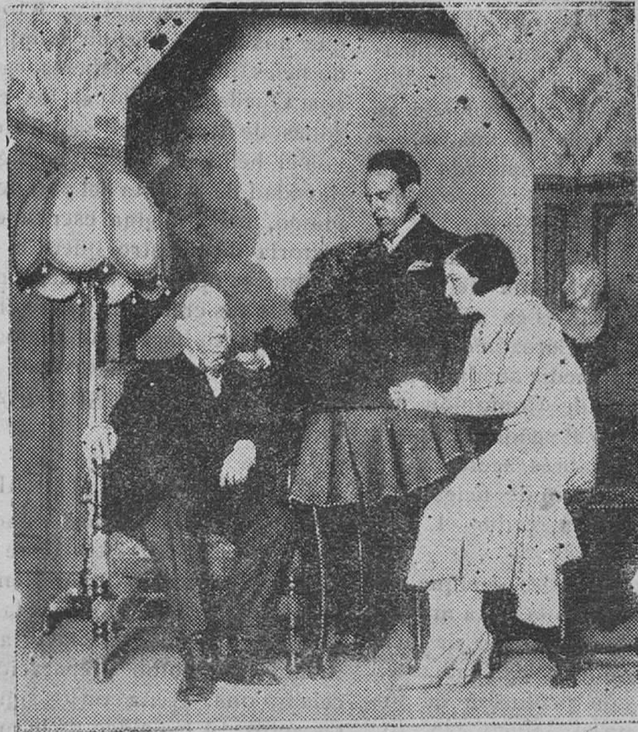
MADRID.—Una escena de la comedia «El oro del diablo», estrenada en el Teatro Alkazar