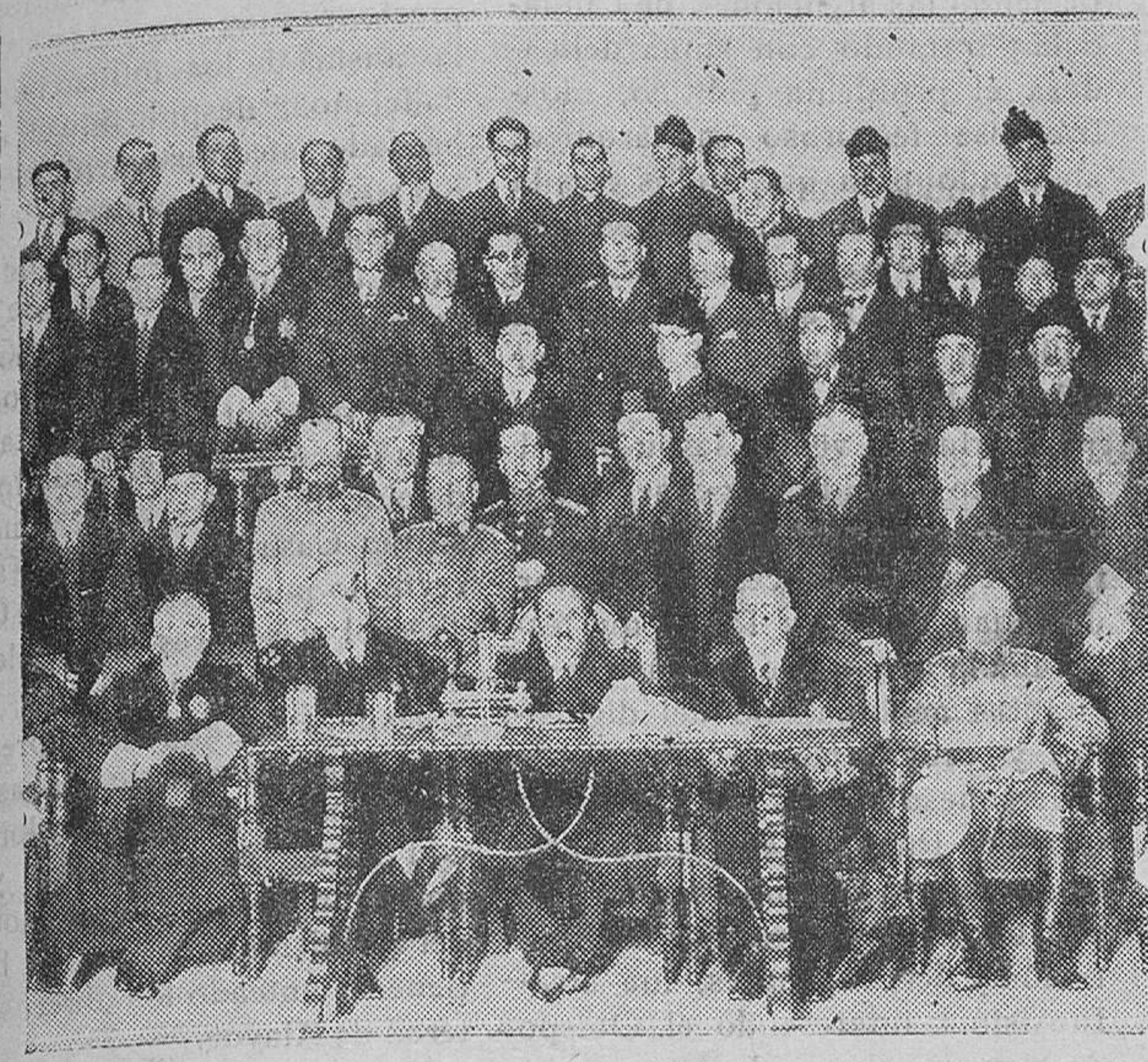
MADRID.—Concurrentes a la sesión de clausura de la Asamblea de Abogados