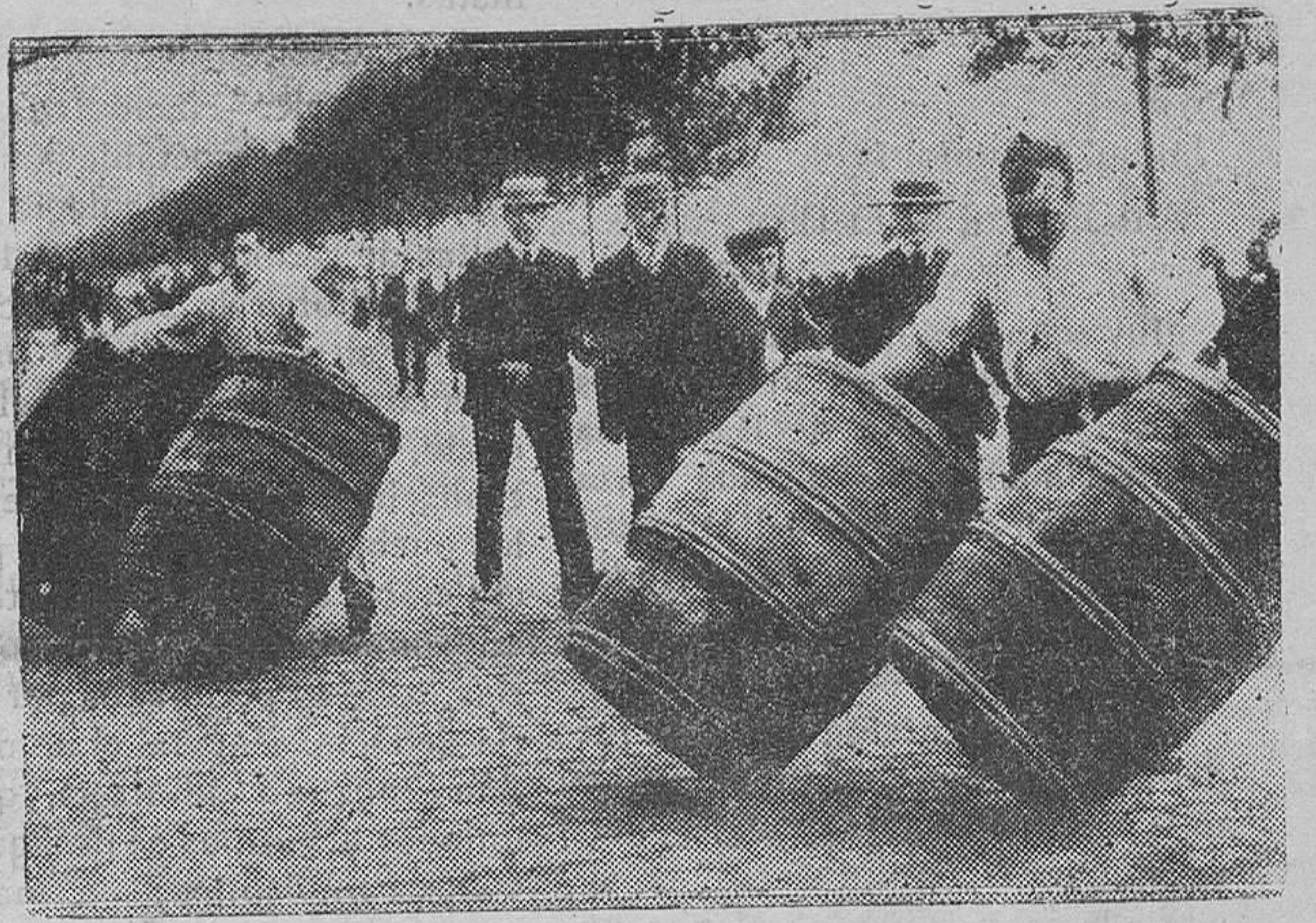
PARIS.—Todos los años los toneleros de París celebran una original carrera, de un recorrido de tres kilómetros, en el barrio de Bercy.—El momento de aproximarse a la meta los dos ganadores de la prueba