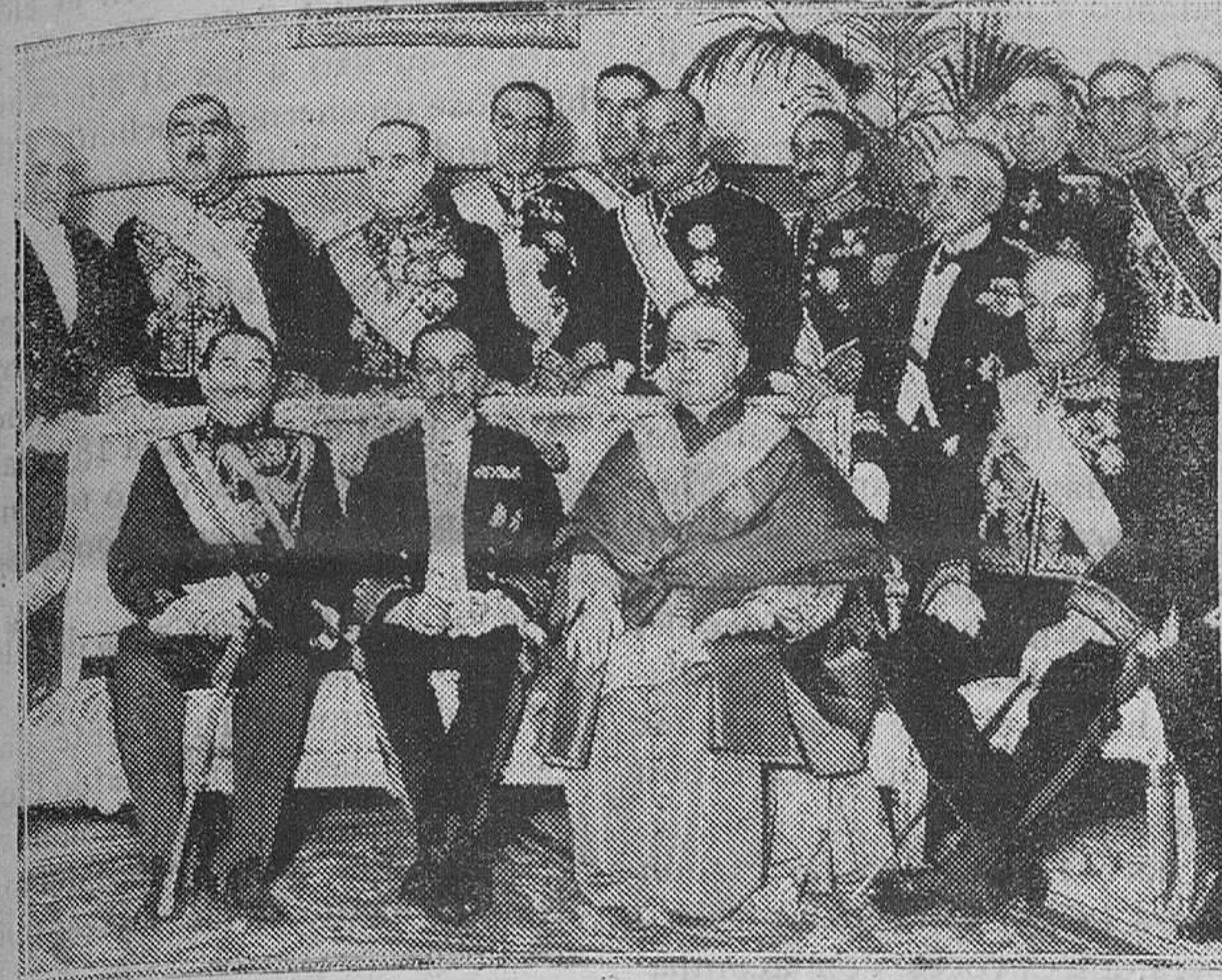
MADRID.—S. M. el Rey, el Nuncio de Su Santidad, con el Gobierno y el Cuerpo Diplomático acreditado en la Corte, en el banquete conmemorativo celebrado en la Nunciatura

Hotel Ansonia, Nueva York de Mayo de 1930.