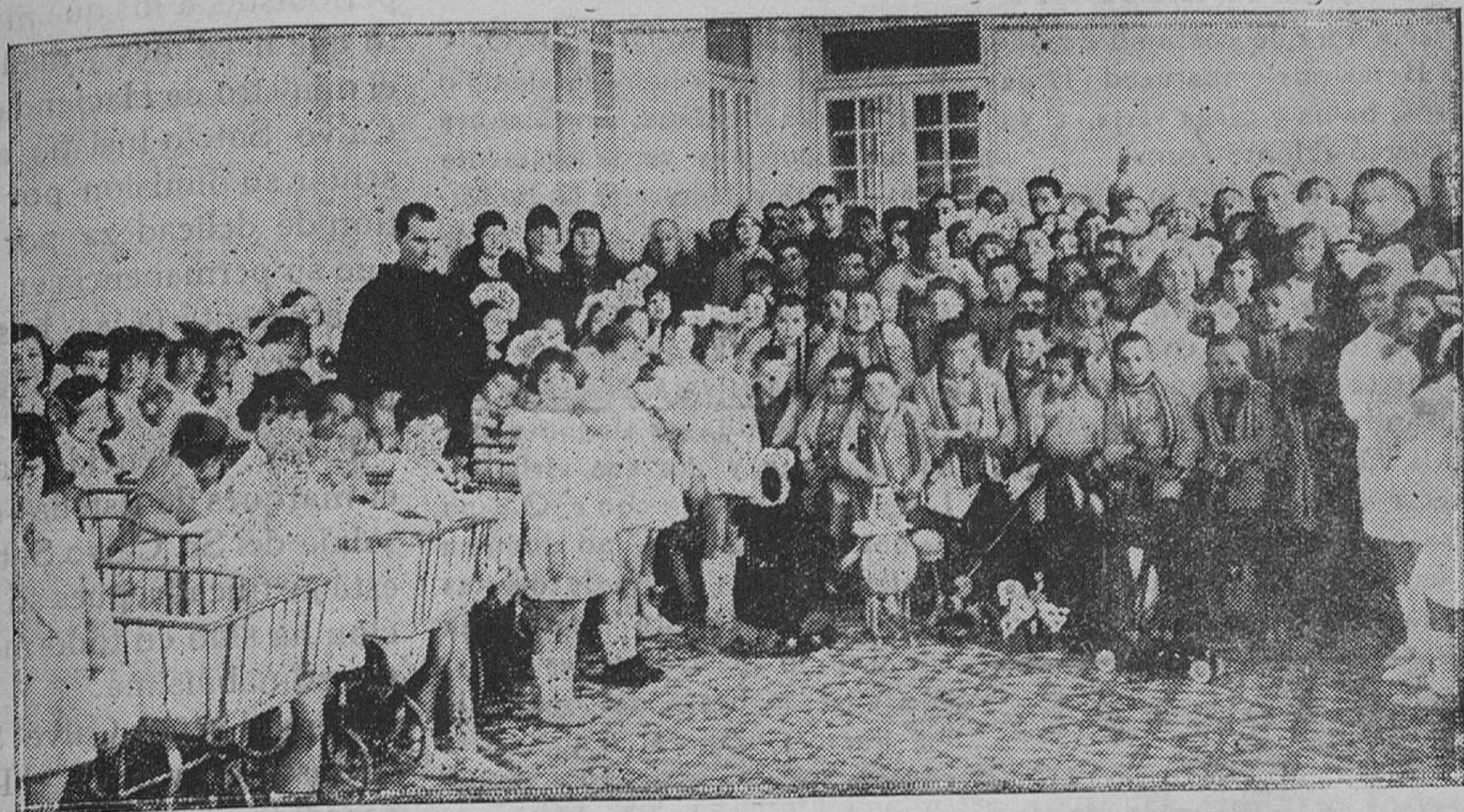
MADRID.—Más de un centenar de niños de las Escuelas Municipales de Madrid fueron a distraer durante unas horas y llevarles juguetes a los 32 asilados que dieron su sangre para otros niños enfermos del terrible mal de la parálisis y a los demás enfermos del Asilo de San Rafael.