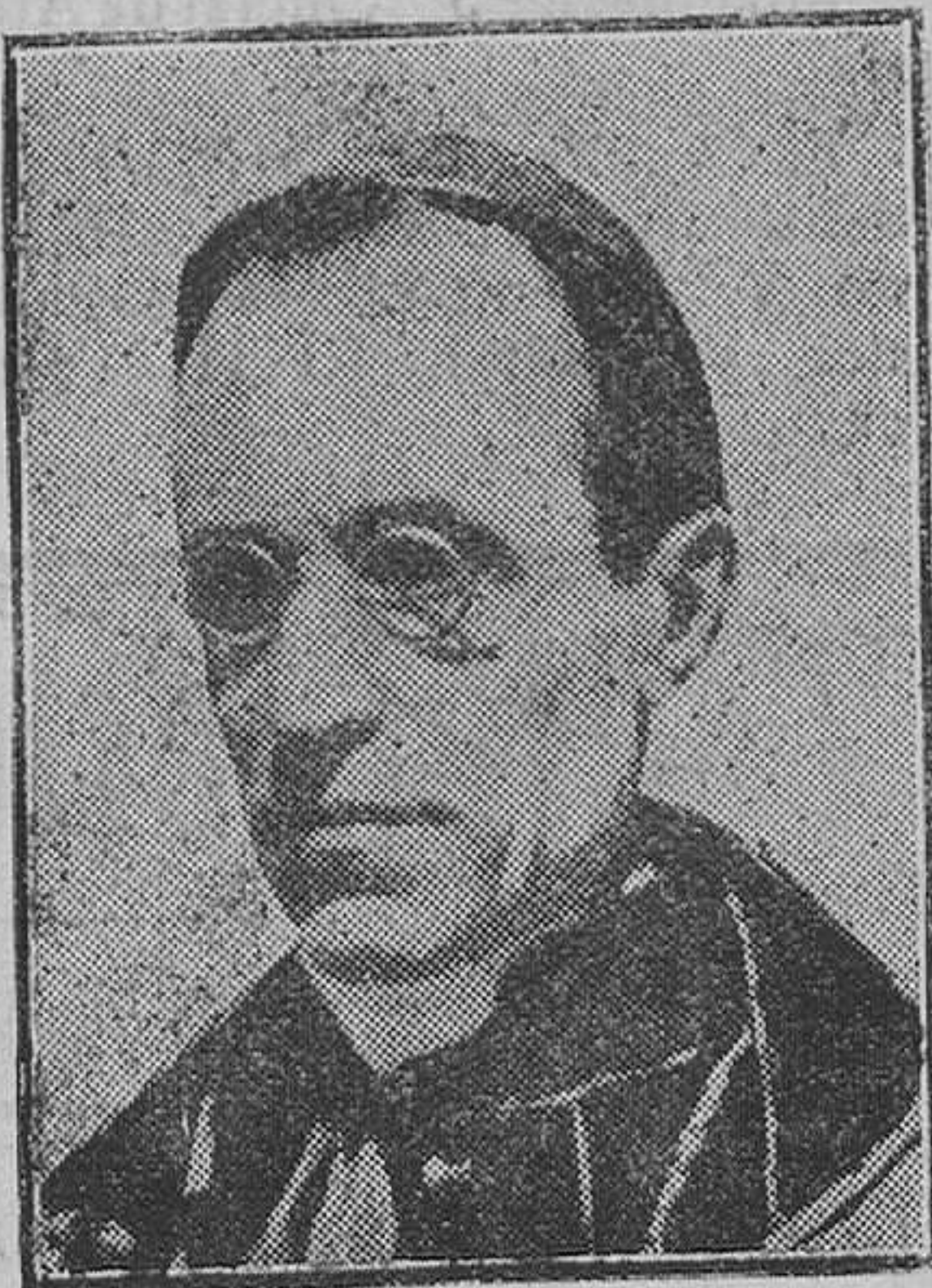
Monseñor Pacelli, que según anuncia la prensa italiana, tomará de un momento a otro posesión del cargo de Secretario de Estado del Vaticano.

Lo único que deseamos es que se llegase a un «statu quo» éste sea conteste con las necesidades, historia y progreso de nuestra España.