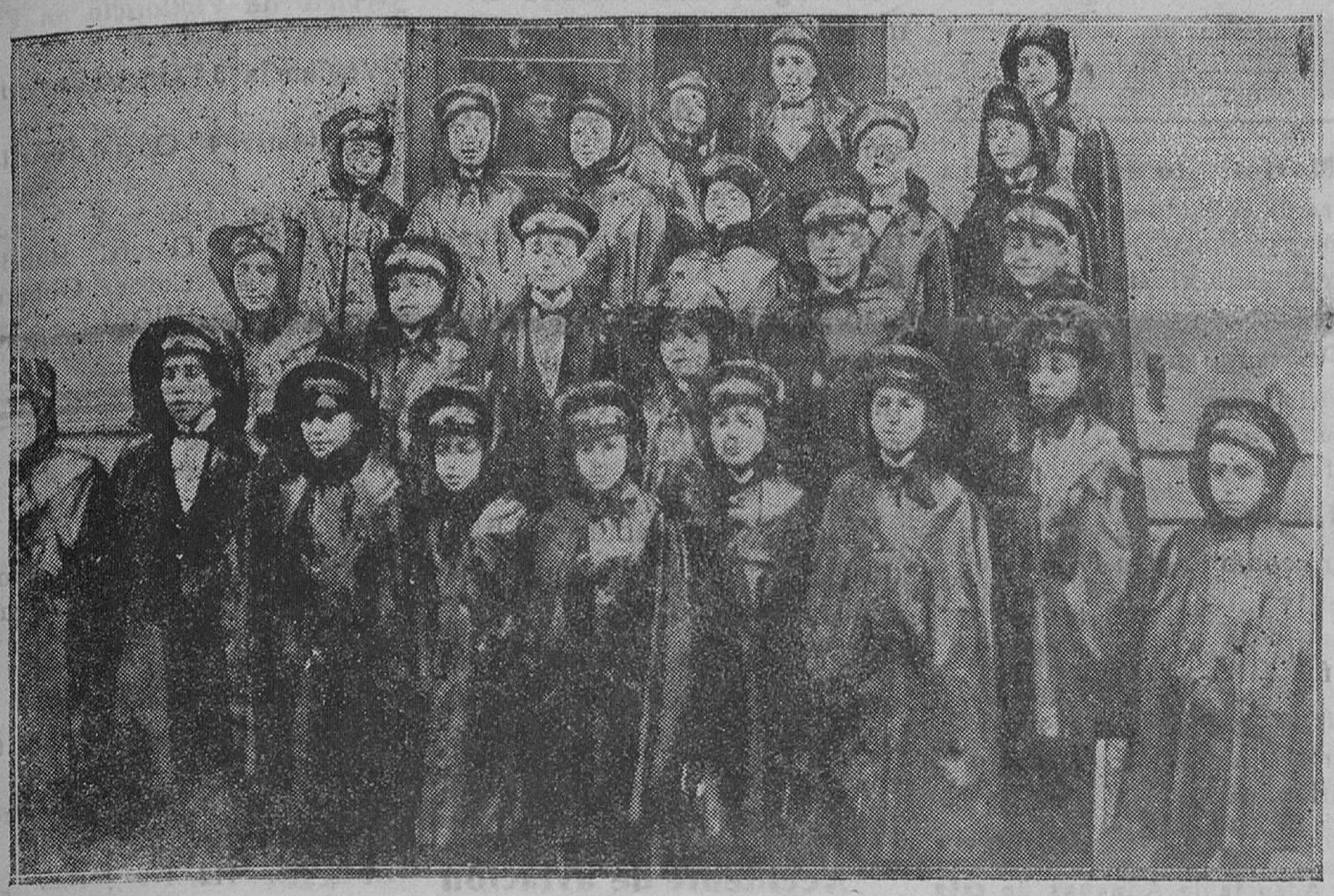
MADRID.—Los niños del Colegio de San Ildefonso encargados de cantar los números y premios del sorteo de la Lotería de Navidad