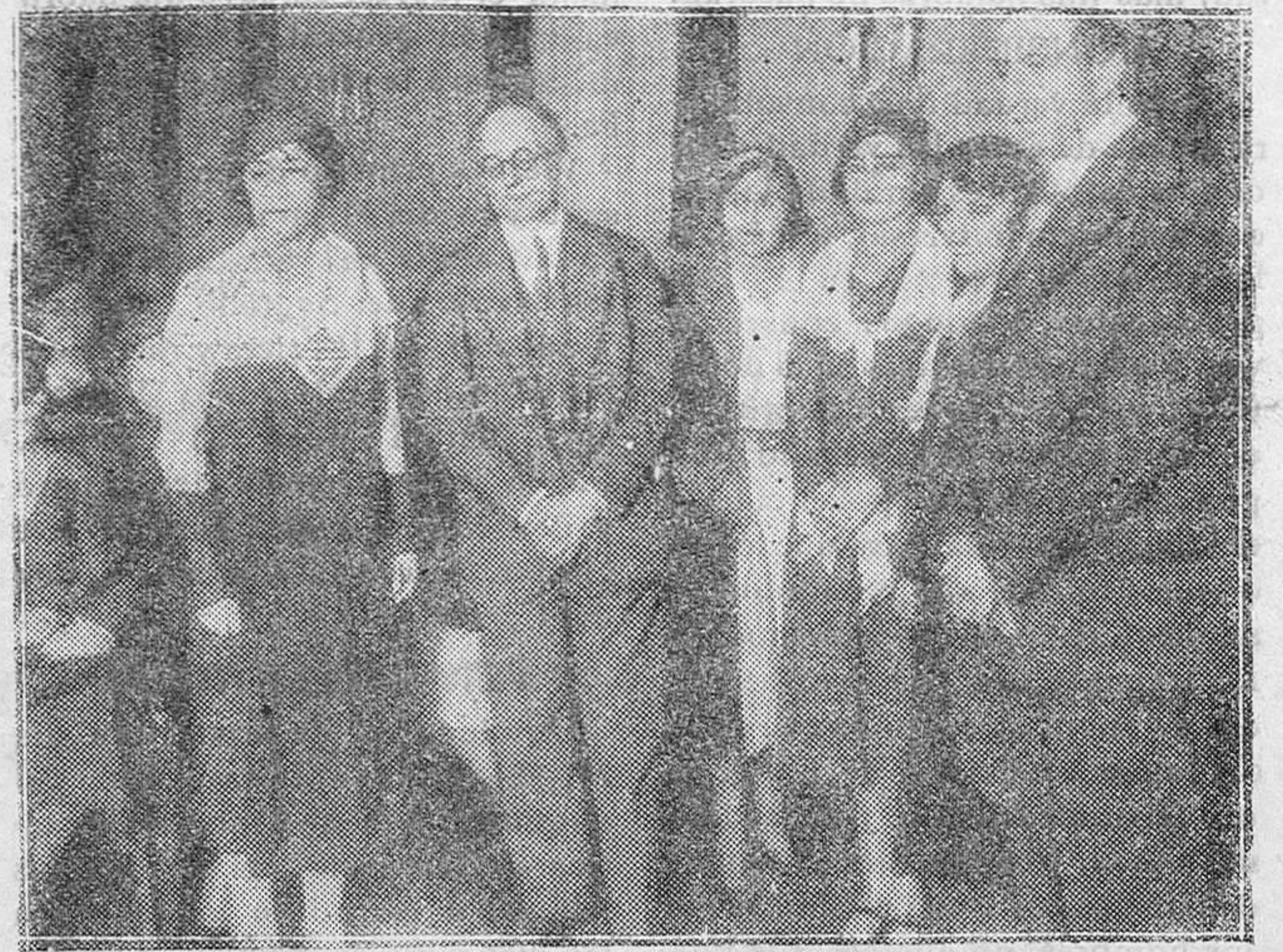
MADRID.—Don Salvador Madariaga y don Pedro Salinas en la velada celebrada en el Lyceum Club Femenino en memoria de Gabriel Miró

Como el literato insigne, como el ilustre autor de «Señora Ama», de «Intereses creados», cuantos amamos a nuestra España y orgullosos estamos de su gloria pretérita, sentimos en estos momentos no tener alas, libertad como esas avecillas para echar a volar, dejando la inclemencia de las pasiones, de los rencores y los odios, la tierra que nuestra glebas de ambiciones y egoísmos, que cubren matas y matojos, hierbajos ácidos de la ran-