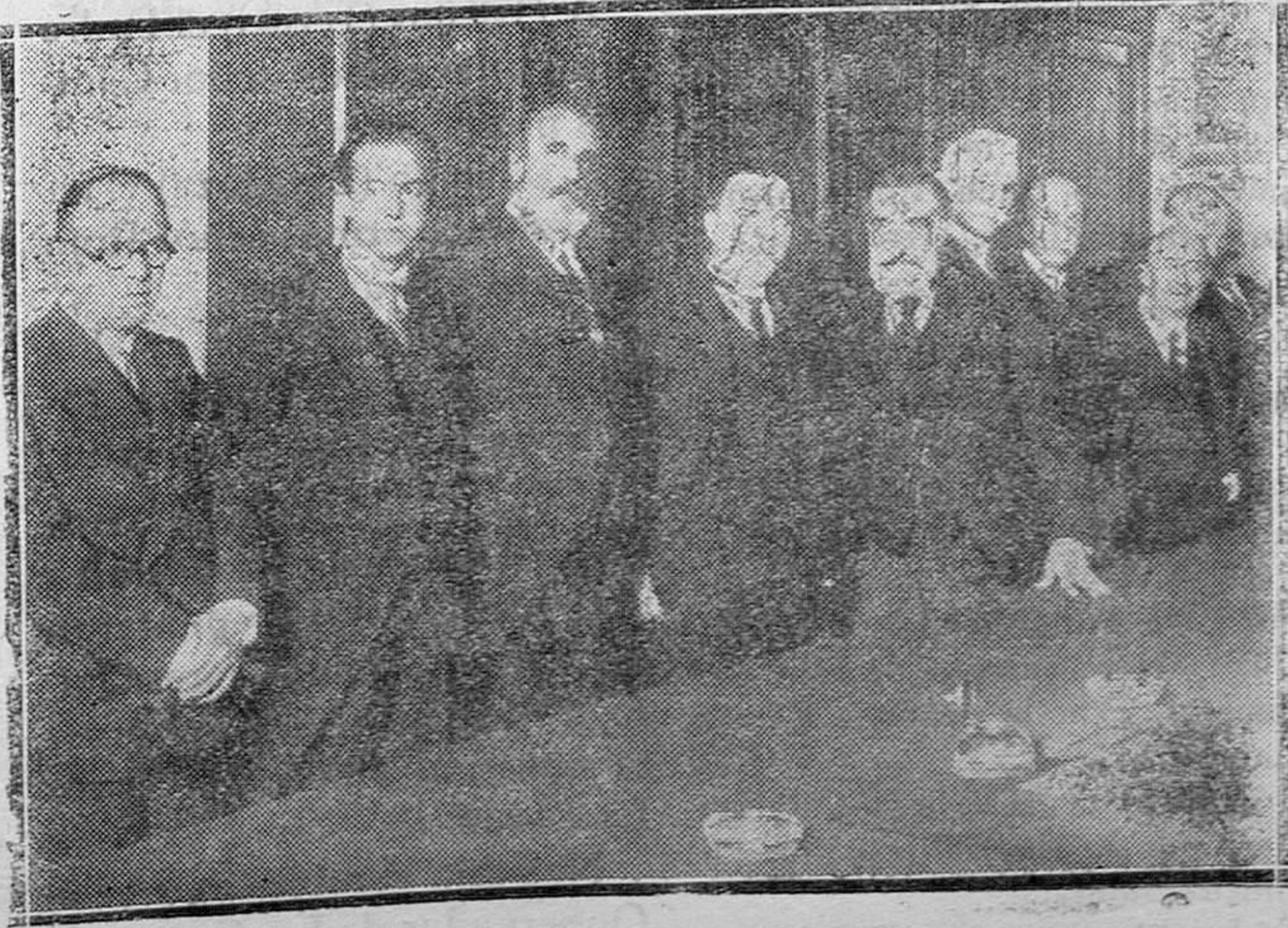
MADRID.—En la Academia de Ciencias Exactas, Físicas y Naturales. — Un detalle de la inauguración del curso 1931-32