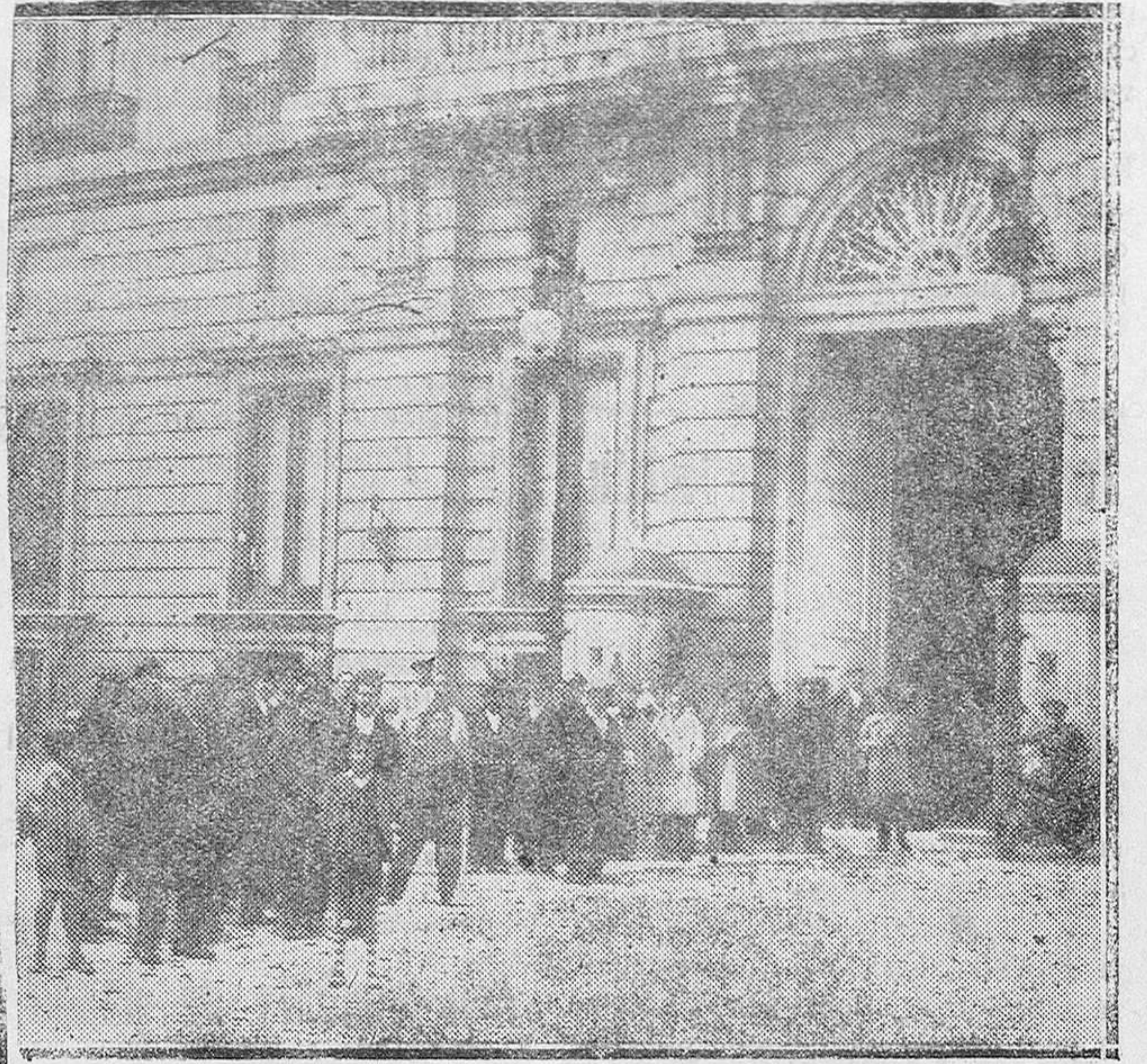
MADRID.—La cola que espera para entrar en el Palacio Real, que ha quedado como Museo público

Lo hecho, hecho está, y ni siquiera cabe discutirlo ahora; pero los legisladores cambian y los futuros procederán según el mandato que reciban del pueblo, que en todo caso no habría torgado a las actuales Constituyentes otros poderes que los precisos para redactar una Constitución.