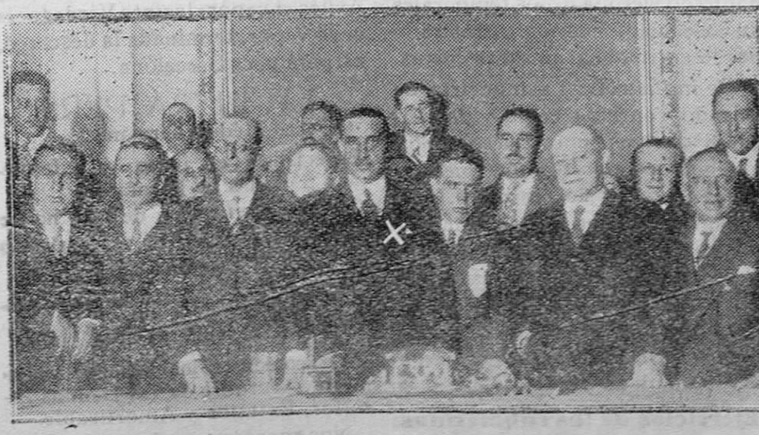
MADRID. — Don Miguel Maura en el Círculo de la Unión Mercantil después de la conferencia que dió días pasados en dicha entidad