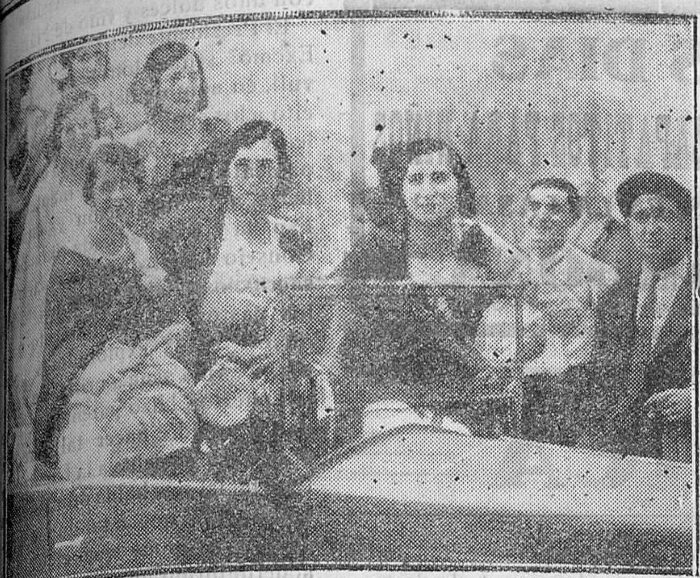
Grupo de señoras que presidieron la becerrada benéfica que organizó la Sociedad «Cute Choqui», de Tolosa, para los obreros sin trabajo