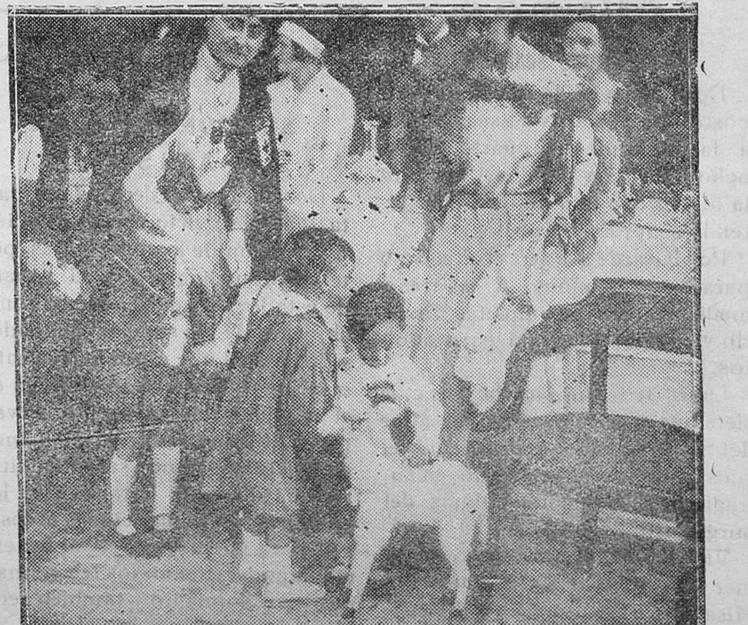
Los niños de las familias que residen en los Fuertes de Hales (Francia) hacen un regalo al príncipe heredero de Marruecos Muley Nassan, que, con su padre, ha visitado dicho lugar