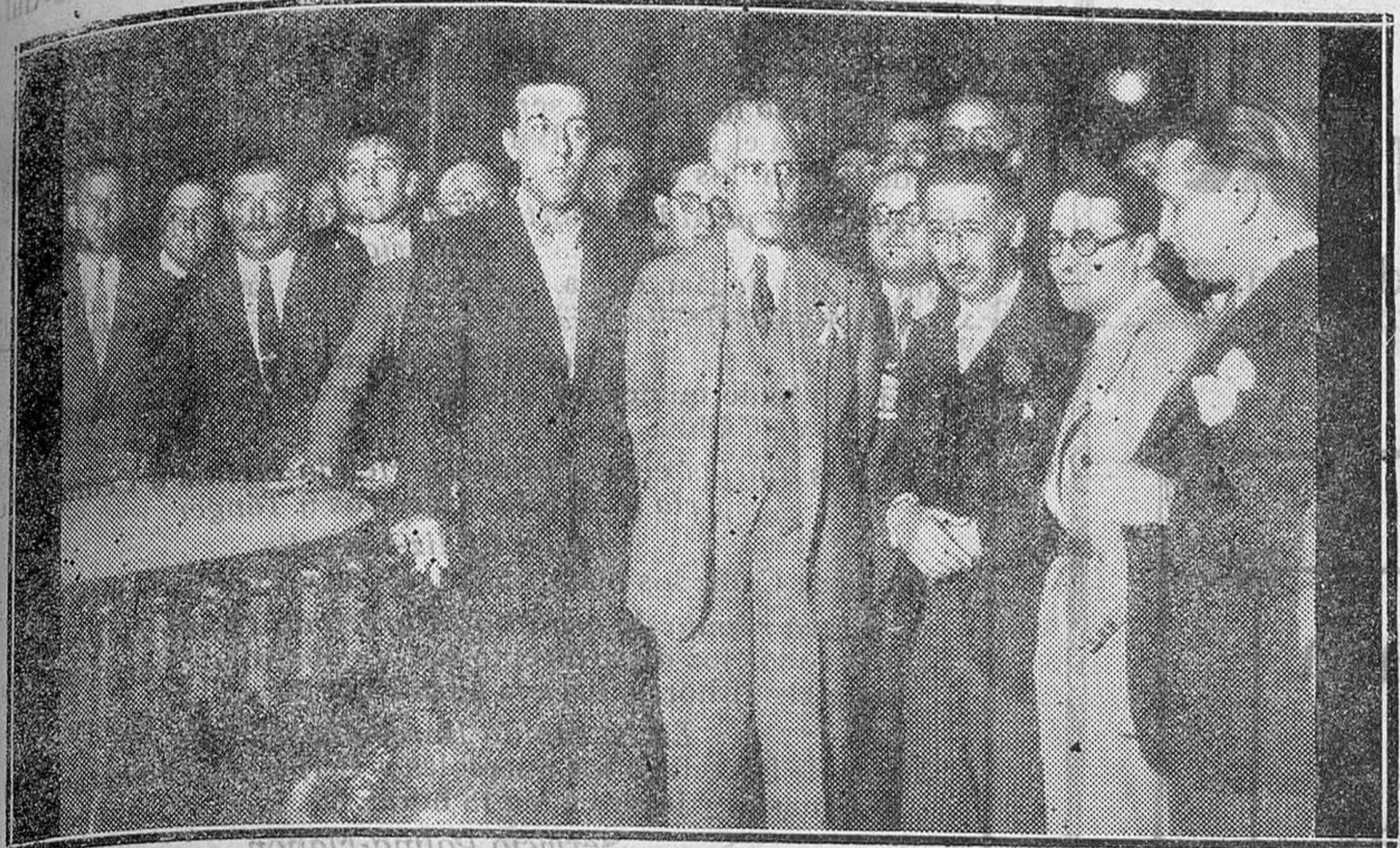
El señor Maciá en el Congreso, hablando con los periodistas

Véndese en la Librería de MA-NUEL SINTES ROTGER, plaza de Pablo Iglesias 17, Mahón.