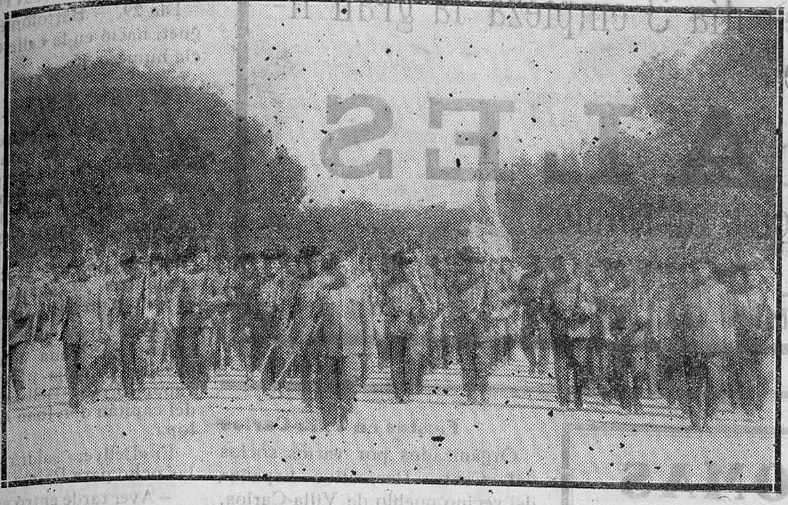
MADRID.—En la estatua de Castelar, la Guardia civil desfilando ante ella, en la cual depositaron una corona de flores