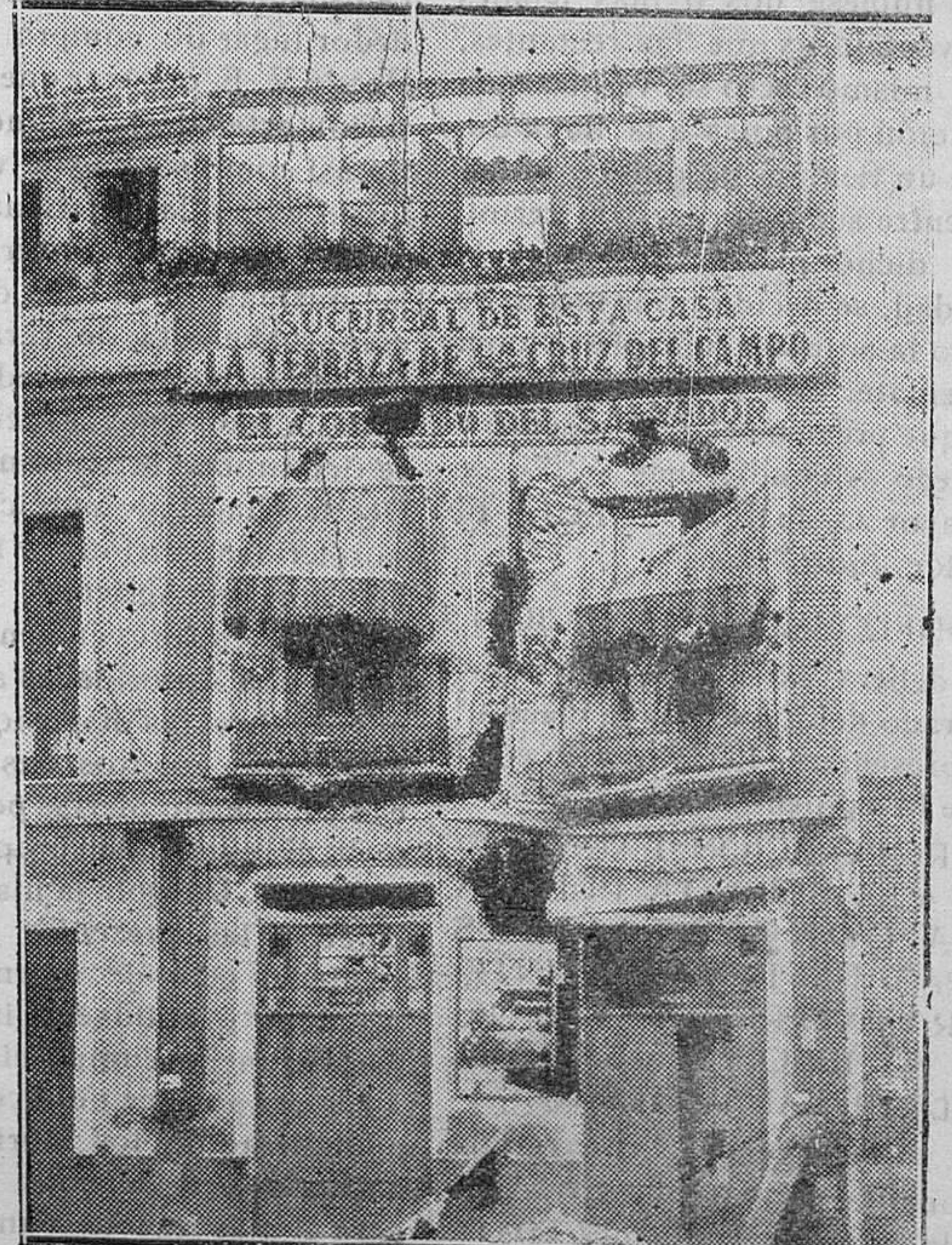
SEVILLA.—De los graves sucesos.—Estado en que quedó la Casa Cornelio, de la calle de Bécquer número 1, después de haber sido bombardeada