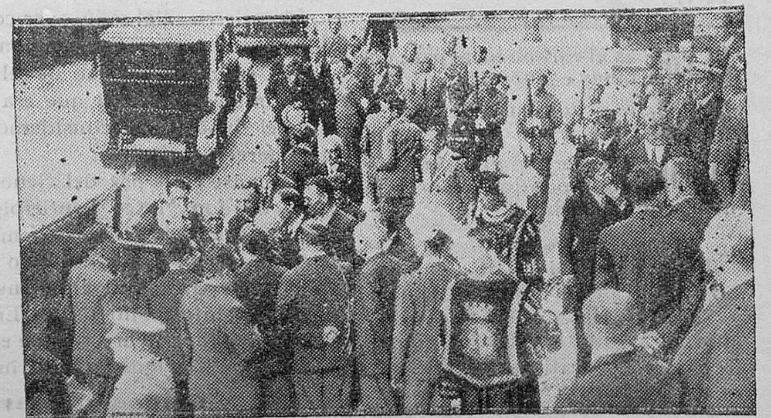
MADRID.—El momento de descender del automóvil a su llegada al Congreso, de los señores Alcalá Zamora y Lerroux

¡Ah! Pero todo eso era antes. Ahora, el señor Azaña, cuyos estudios militares anteriores sólo nos eran conocidos a través de una obra, ni demasiado extensa, ni demasiado honda, de política militar francesa, resulta que puede acua-