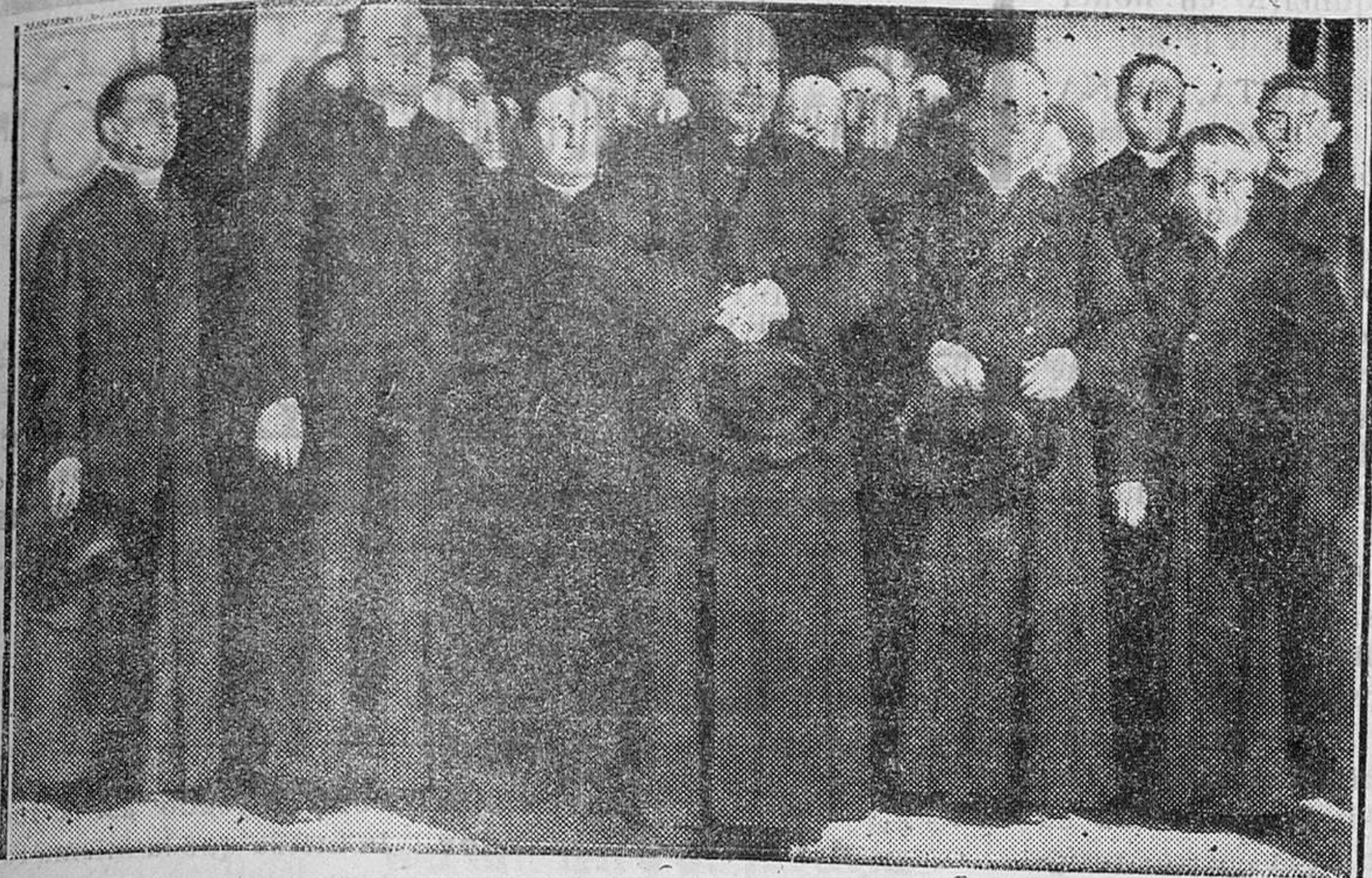
Prímado de Toledo, Cardenal Segura, rodeado de las autoridades eclesiásticas y civiles que acudieron a la estación de Roma para recibirle