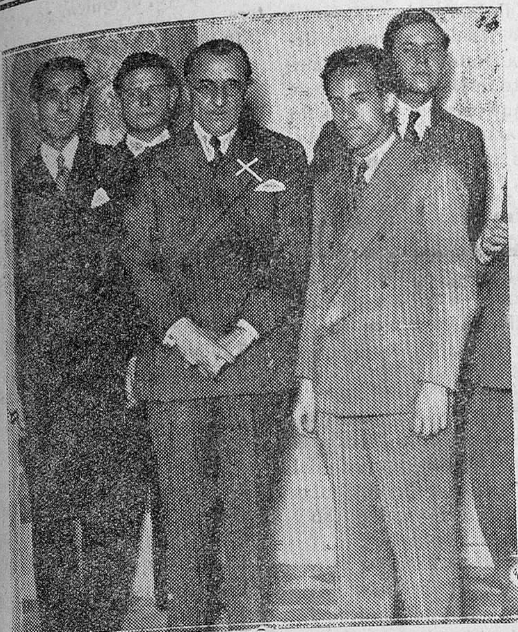
En la Juventud Monárquica Independiente. — Don Ramiro de Maeztu (x) después de su conferencia versando sobre «La verdadera Constitución de España»