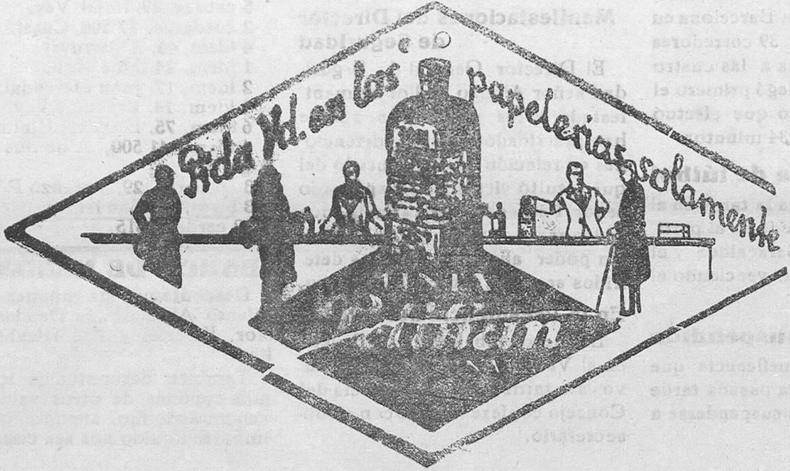
De venta en la Librería de MANUEL SINTES ROTGER , Plaza de Pablo Iglesias, 17, Mahón

Polyos para teñir en casa toda clase de telas de algodón, lana y sedas en una hora. Se usan los tan sencillos que una niña puede teñir cualquier paño. Gran variedad en colores. Buenos resultados al instante. De venta en la Papelería de Manuel Sintes Rotger, Plaza Pablo Iglesias 17, Mahón.