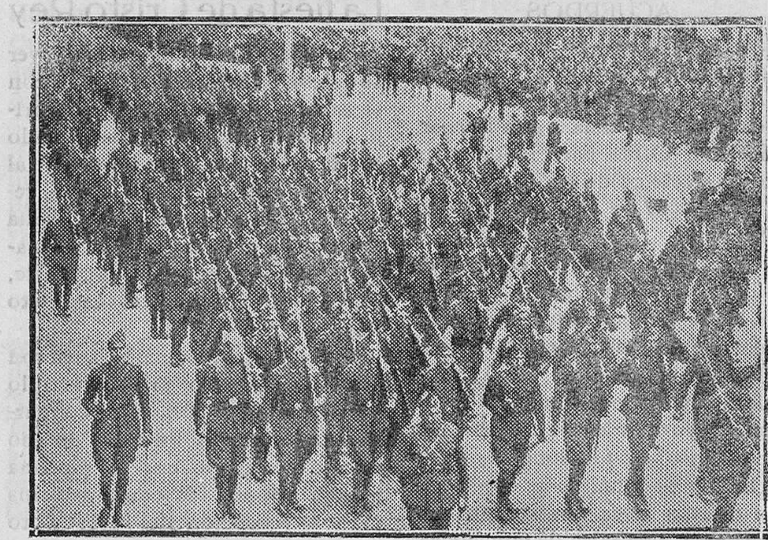
MADRID.—El desfile de tropas por delante de Palacio