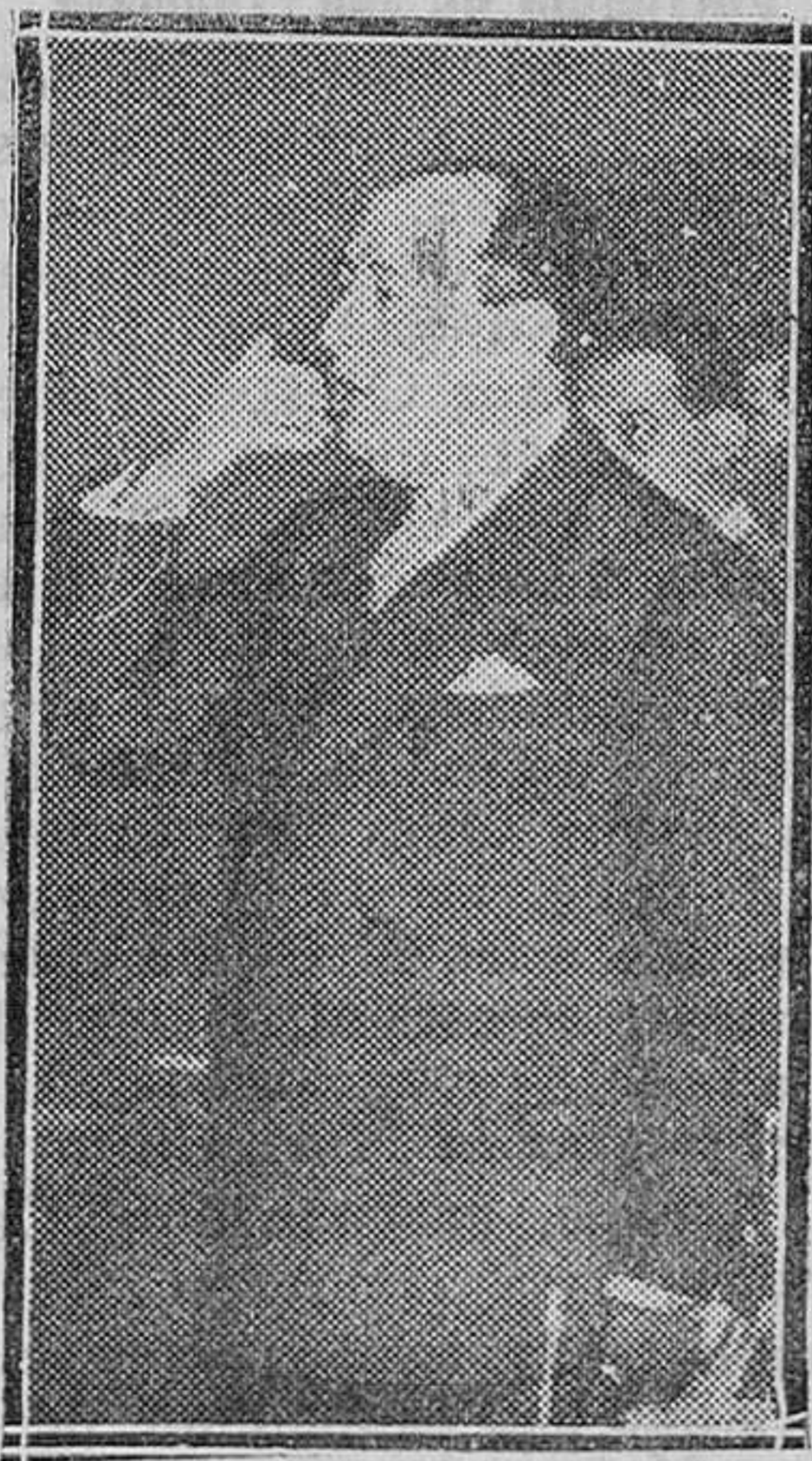
MADRID.—Mitin del domingo.—El señor Gil Robles durante el discurso que pronunció en el Monumental Cinema

Persecución sectaria y disolvente, a cerrarle el paso se dedicaron padres y maestros, celosos los pri-