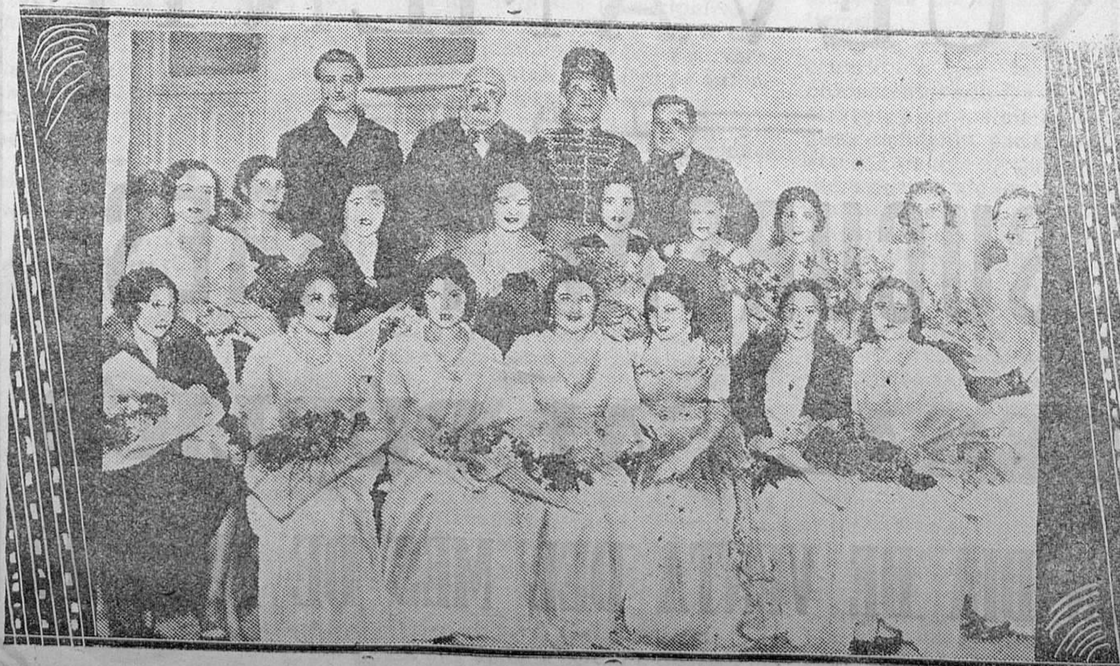
MADRID.—Las bellezas regionales con los artistas del Teatro Calderón a cuya runción asistieron

«En aquel tiempo: Tomó Jesús a los Doce, y les dijo: Vamos a Jerusalén, y todo lo que está escrito por los profetas del Hijo del Hombre, se cumplirá. Porque será entregado a los gentiles, burlado, azotado y escupido; y después de azotado le quitarán la vida y resucitará al tercer día. Más ellos nada de esto entendieron; este lenguaje les era desconocido, y nada entendían de lo que se les decía. Sucedió, pues, que estando cerca de Jericó, un ciego pedía limosna sentado junto al camino. Y oyendo el tropel de gente que pasaba, preguntó que era aquello. Dijéronle que pasaba Jesús de Nazaret. Y clamó diciendo: Jesús, hijo de David, ten compasión de mí. Los que iban delante le reprendían para que