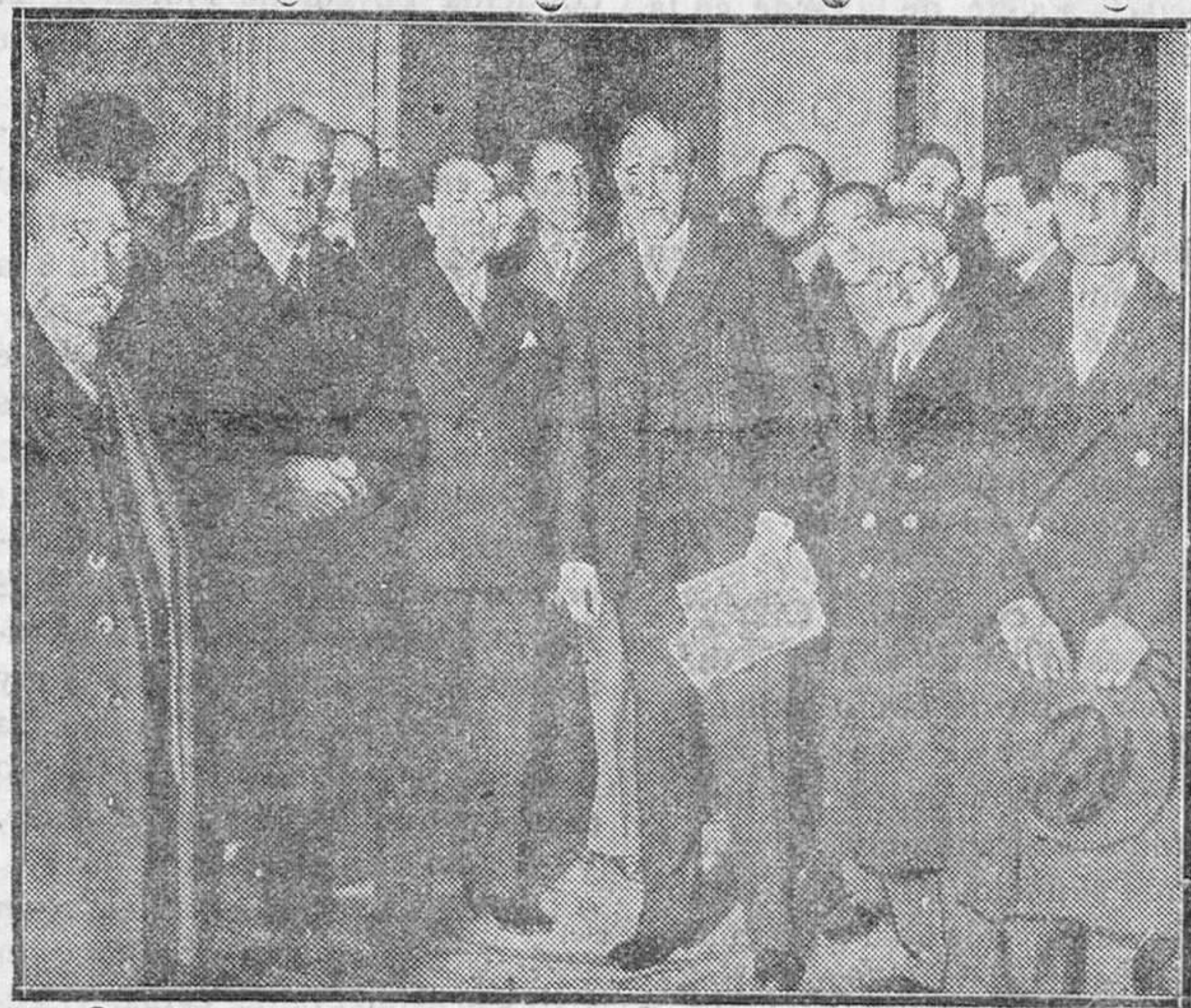
MADRID. — El señor Besteiro acompañado del señor Gil Robles y una comisión de padres de familia que hicieron entrega al Presidente de las Cortes de numerosas solicitudes sobre la enseñanza por las congregaciones religiosas