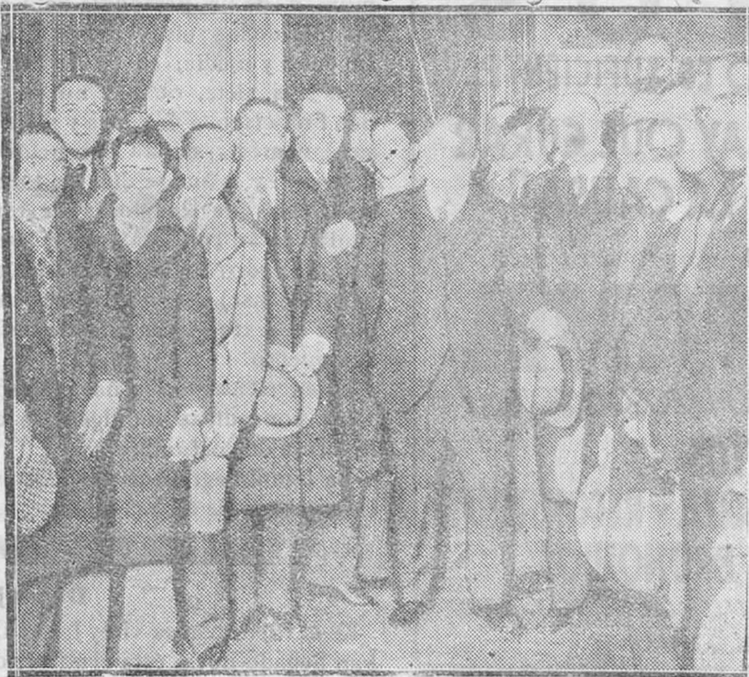
MADRID. — En el Ministerio de Obras Públicas. — Representantes de Ciudad Real en su visita al ministro de Obras Públicas para pedirle la desviación del trazado del ferrocarril Madrid-Badajoz