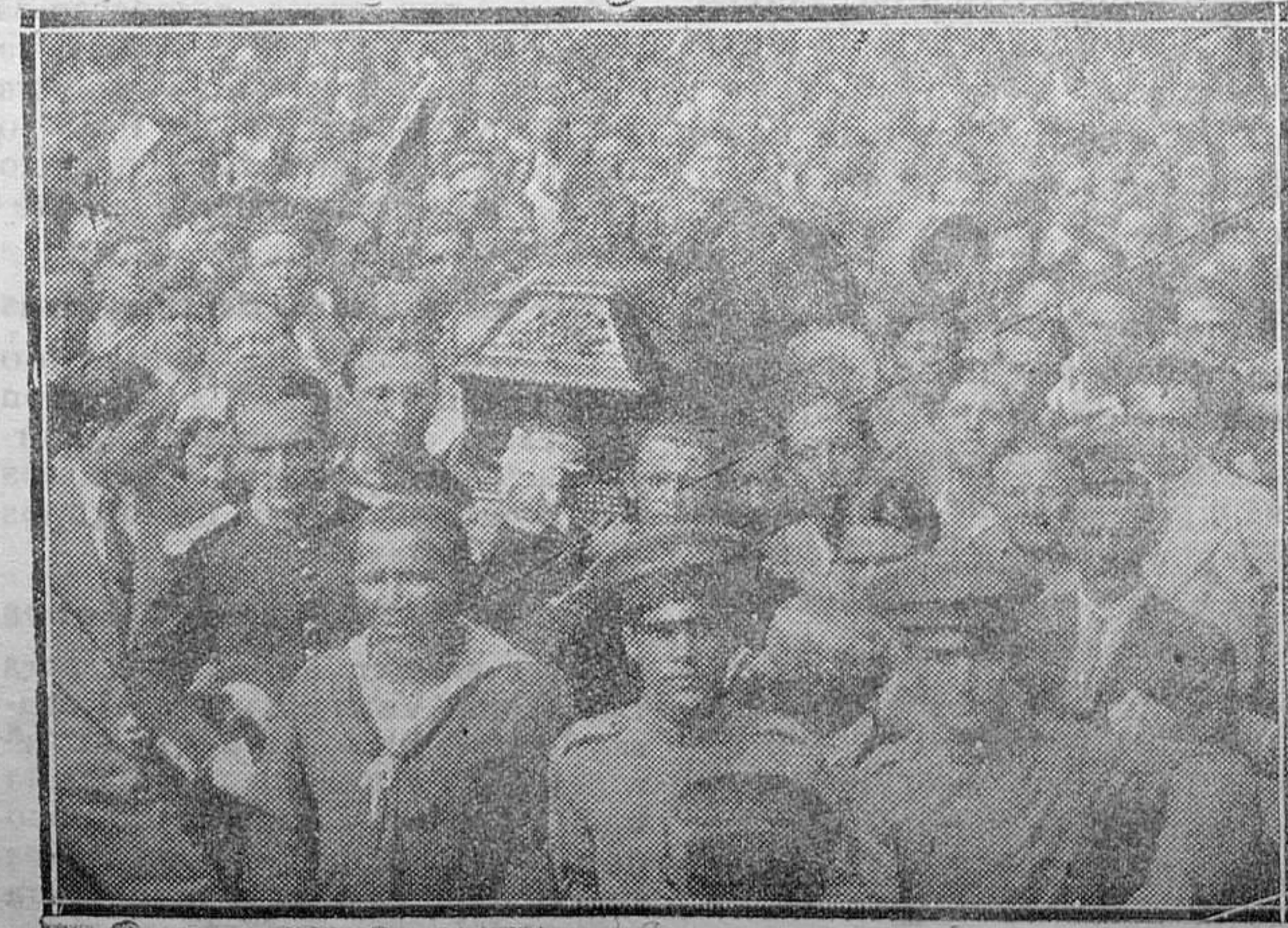
EXTRANJERO. — El traslado del cadáver del aviador Santos Dumont, al Brasil. Los cadetes militares conduciendo el féretro camino de la Catedral de Río Janeiro