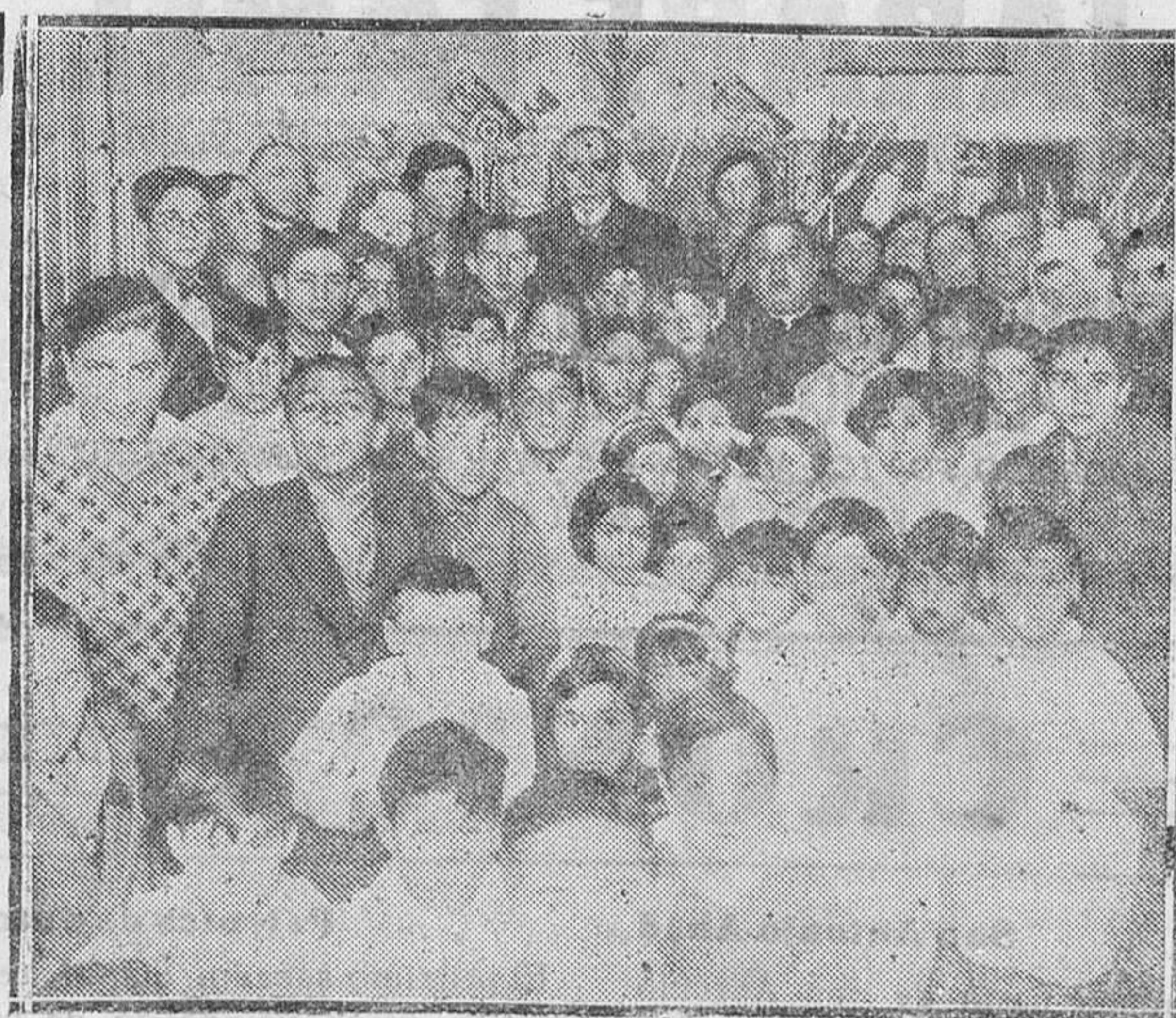
MADRID.—Reparto de juguetes a los niños del Colegio de Nuestra Señora de las Angustias, con motivo de la fiesta de Reyes