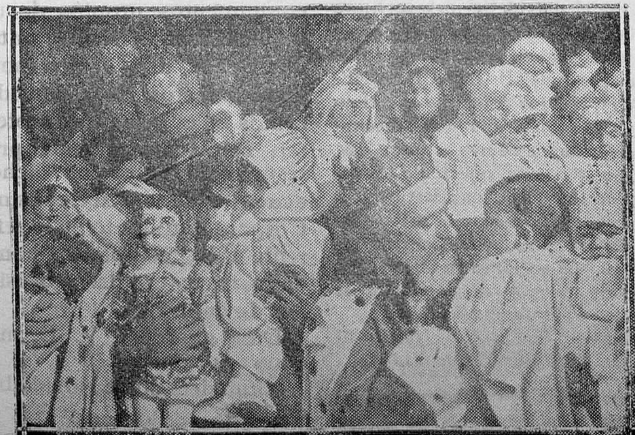
EL DÍA DE REYES EN LA INCLUSA.—He aquí un aspecto del reparto de juguetes a los niños de la Inclusa, acto efectuado con motivo de la Epifanía

HAGO SABER: Que de conformidad con lo dispuesto en el artículo 110 del vigente Reglamento pa-