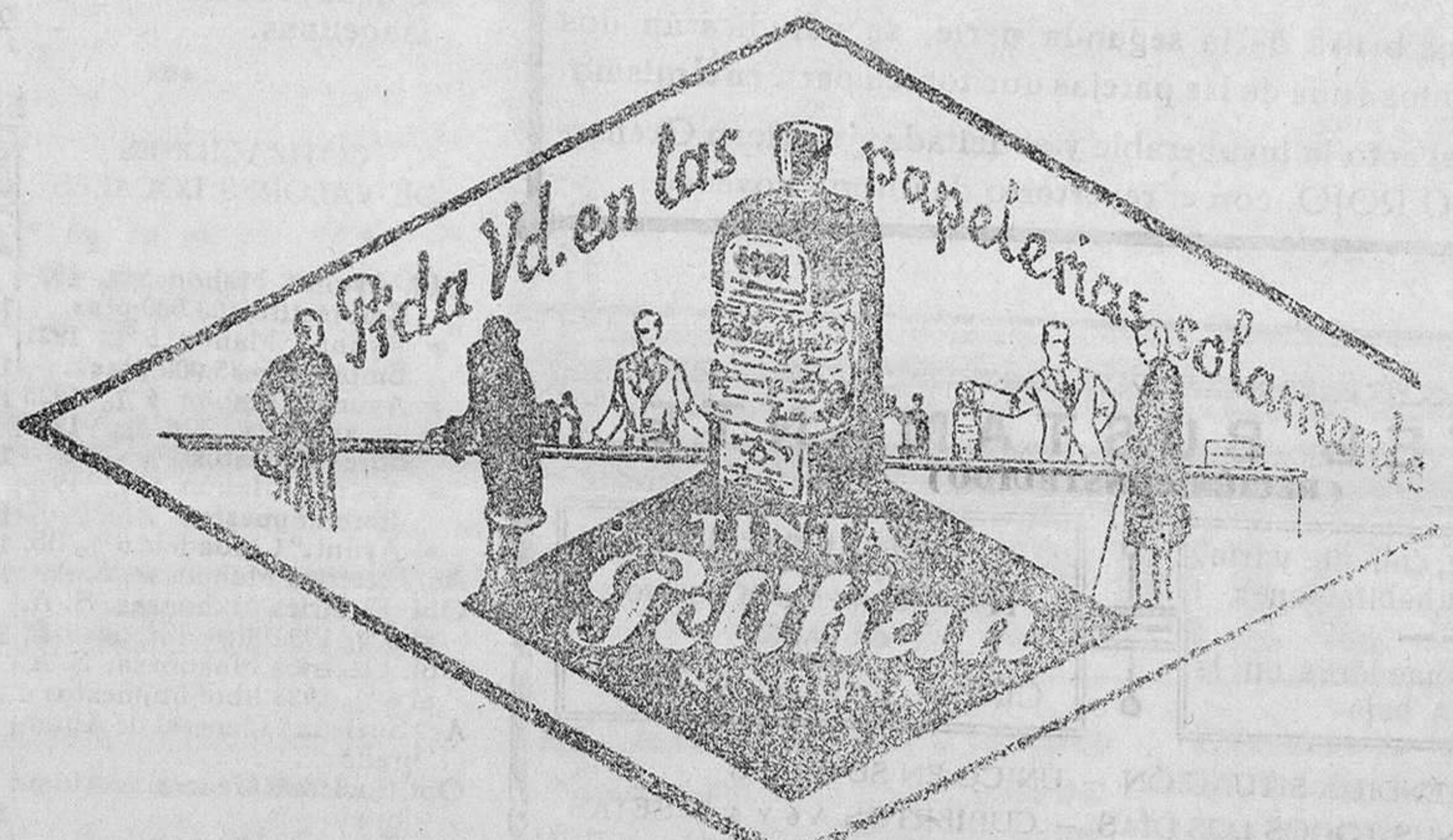
De venta en la Librería de MANUEL SINTES ROTGER, Plaza de Pablo Iglesias, 17, Mahón

DE VENTA EN ESTA IMPRENTA Imp. de M. Sintes Rotger. - Mahón