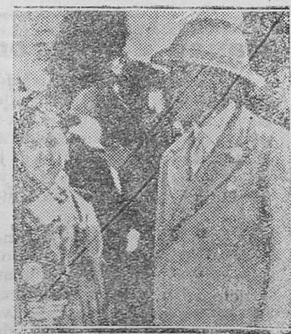
EXTRANJERO.—El Gobernador de Bengala, mister Henderson, que ha sido objeto de un atentado, saliendo ileso.

ALMANAQUE DE EL CULTIVADOR MODERNO PARA 1934