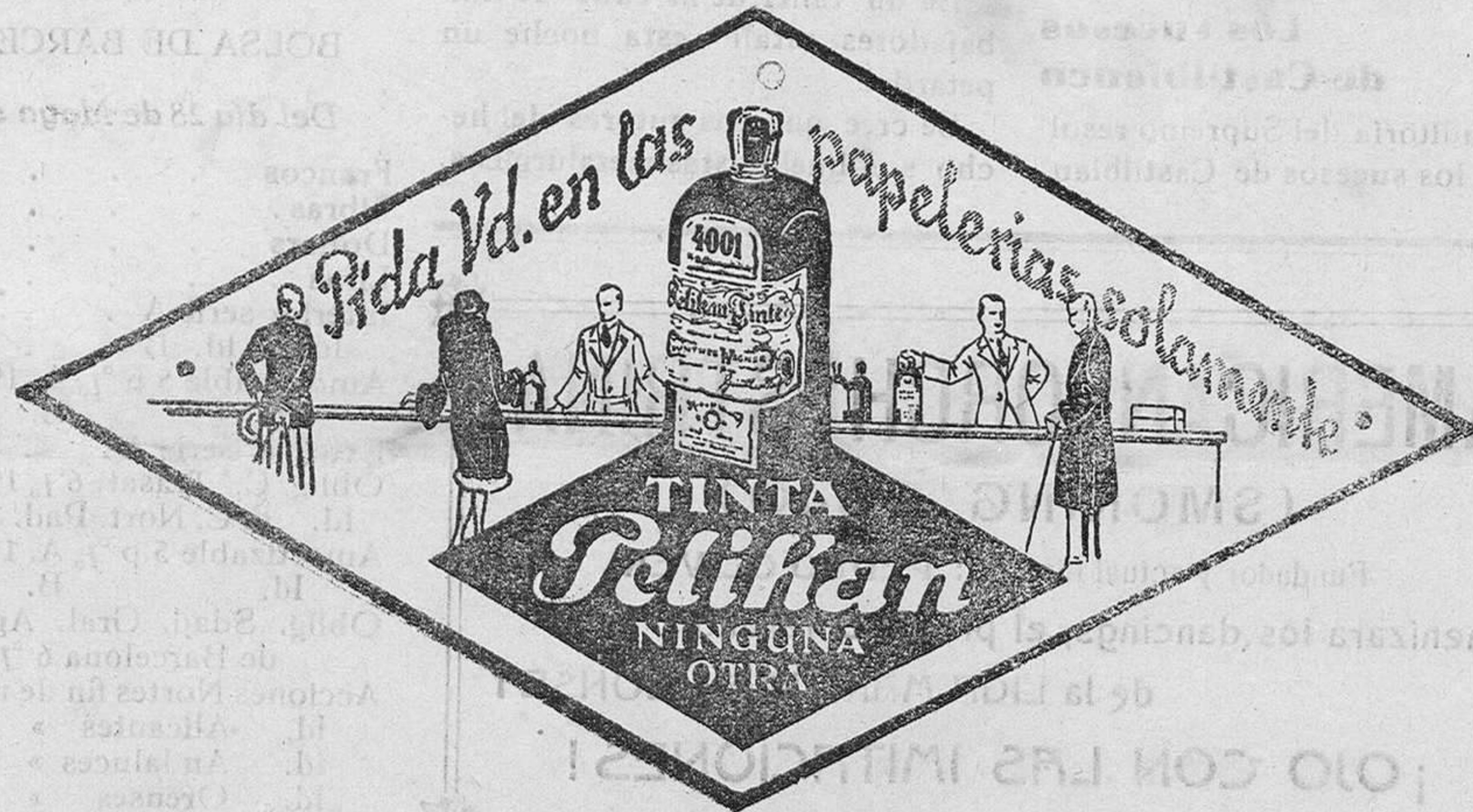
De venta en la Librería de Manuel Sintes Rotger, Plaza del Príncipe 17, Mahón

DE VENTA EN ESTA IMPRENTA Imp. de M. Sintes Rotger. - Mahón