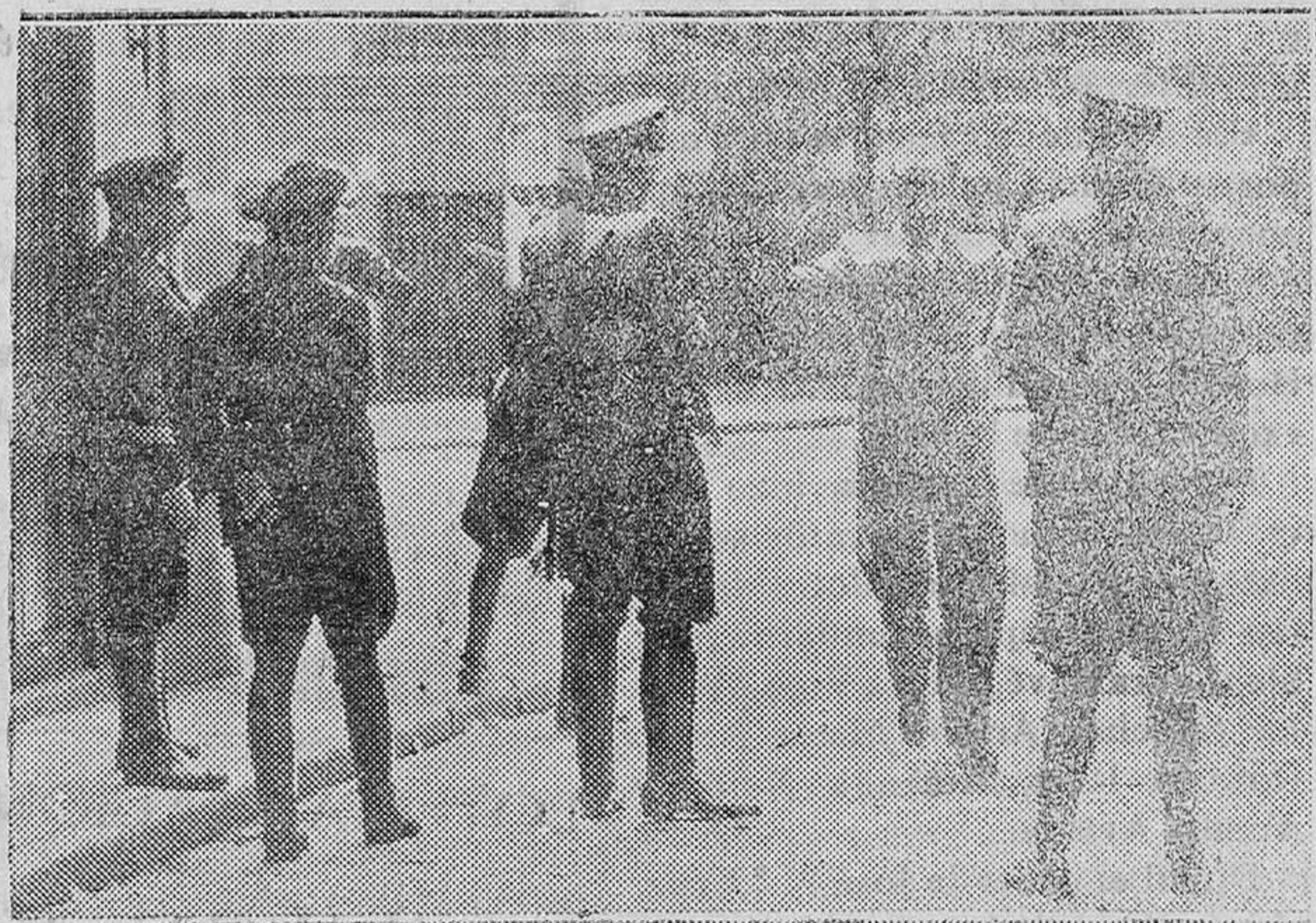
MADRID.—Los sucesos de la Facultad de Medicina