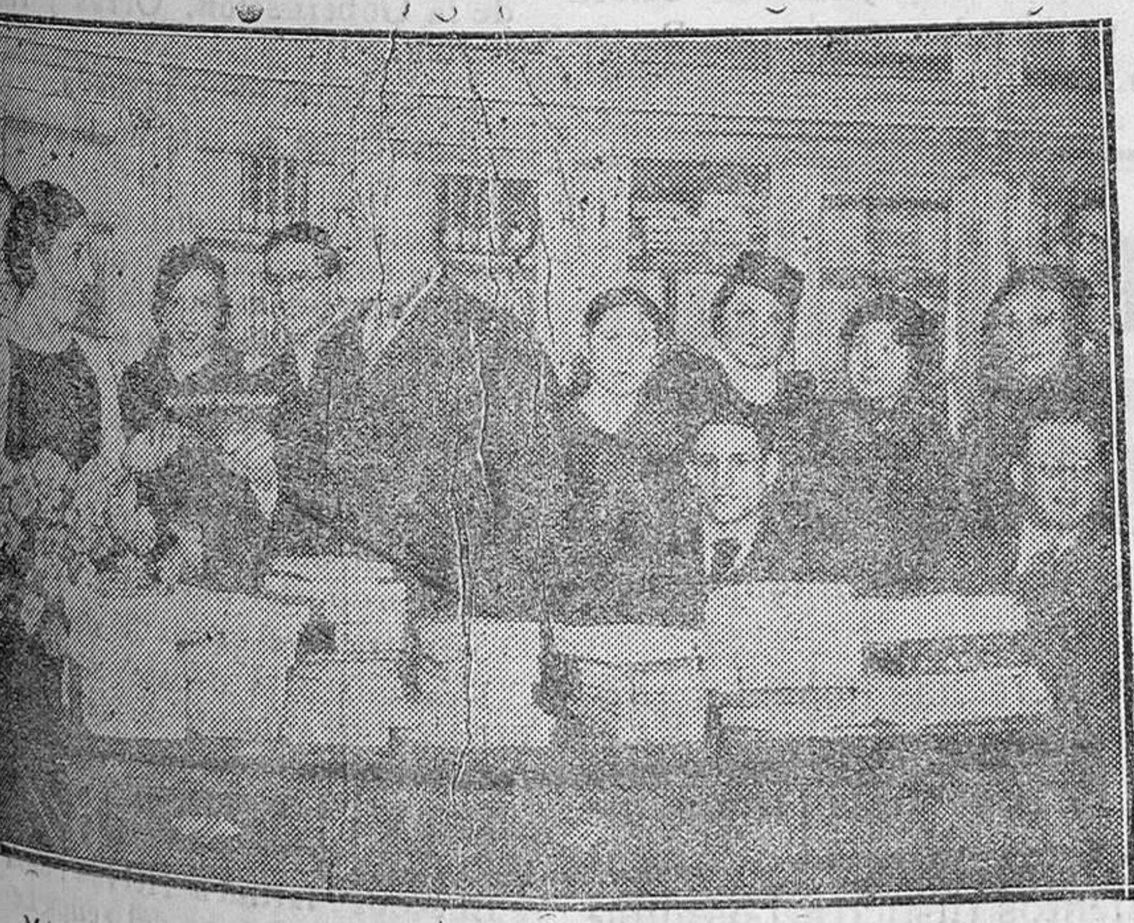
MADRID.—El director de la Escuela Social haciendo entrega de los premios a los graduados