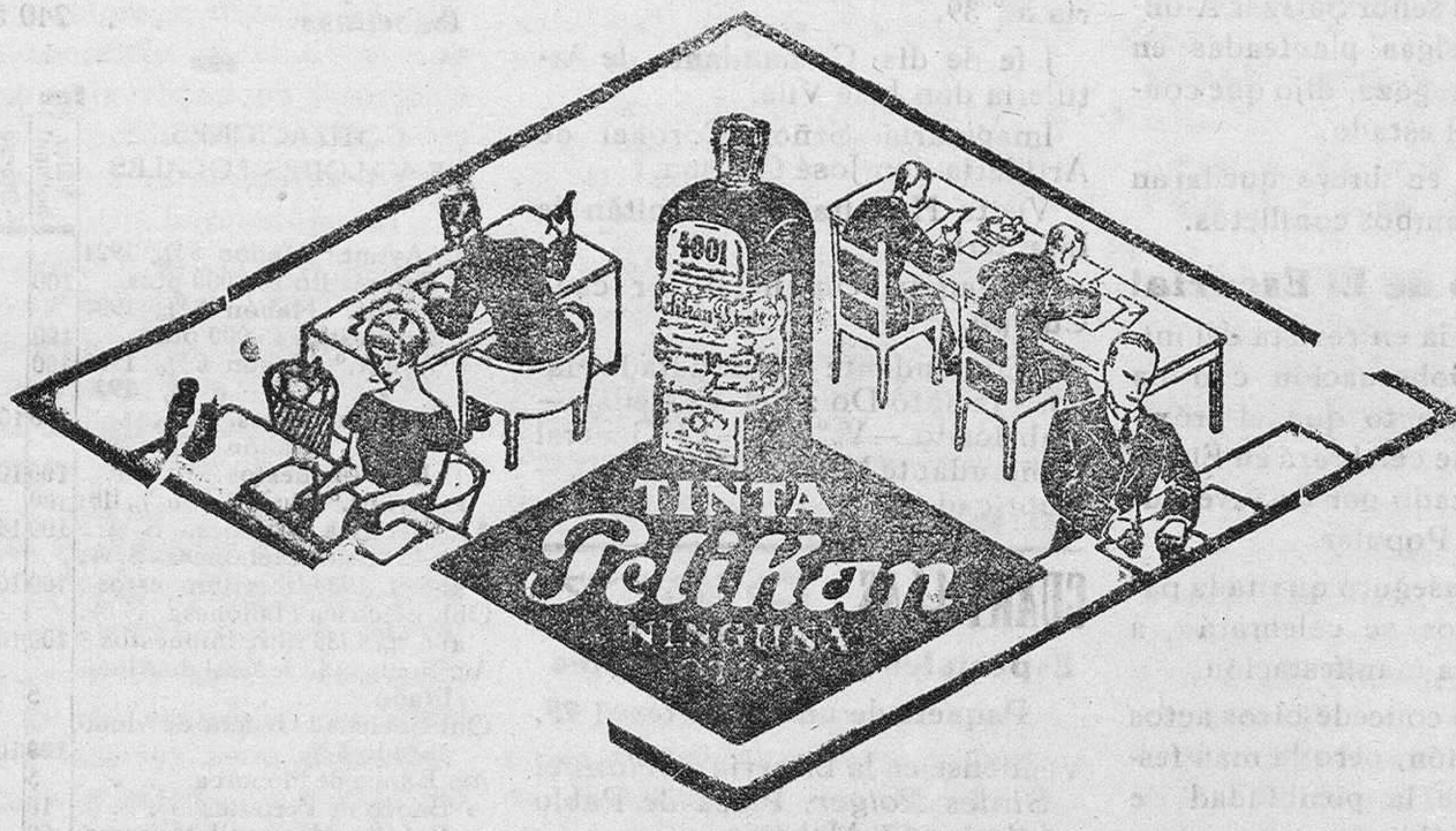
De venta en la Librería de Manuel Sintes Rotger, plaza de Pablo Iglesias 17, Mahón

Libretas de alquiler, listas de embarque altas y bajas para la contribución industrial DE VENTA EN ESTA IMPRENTA Imp. de M. Sintes Rotger. - Mahón