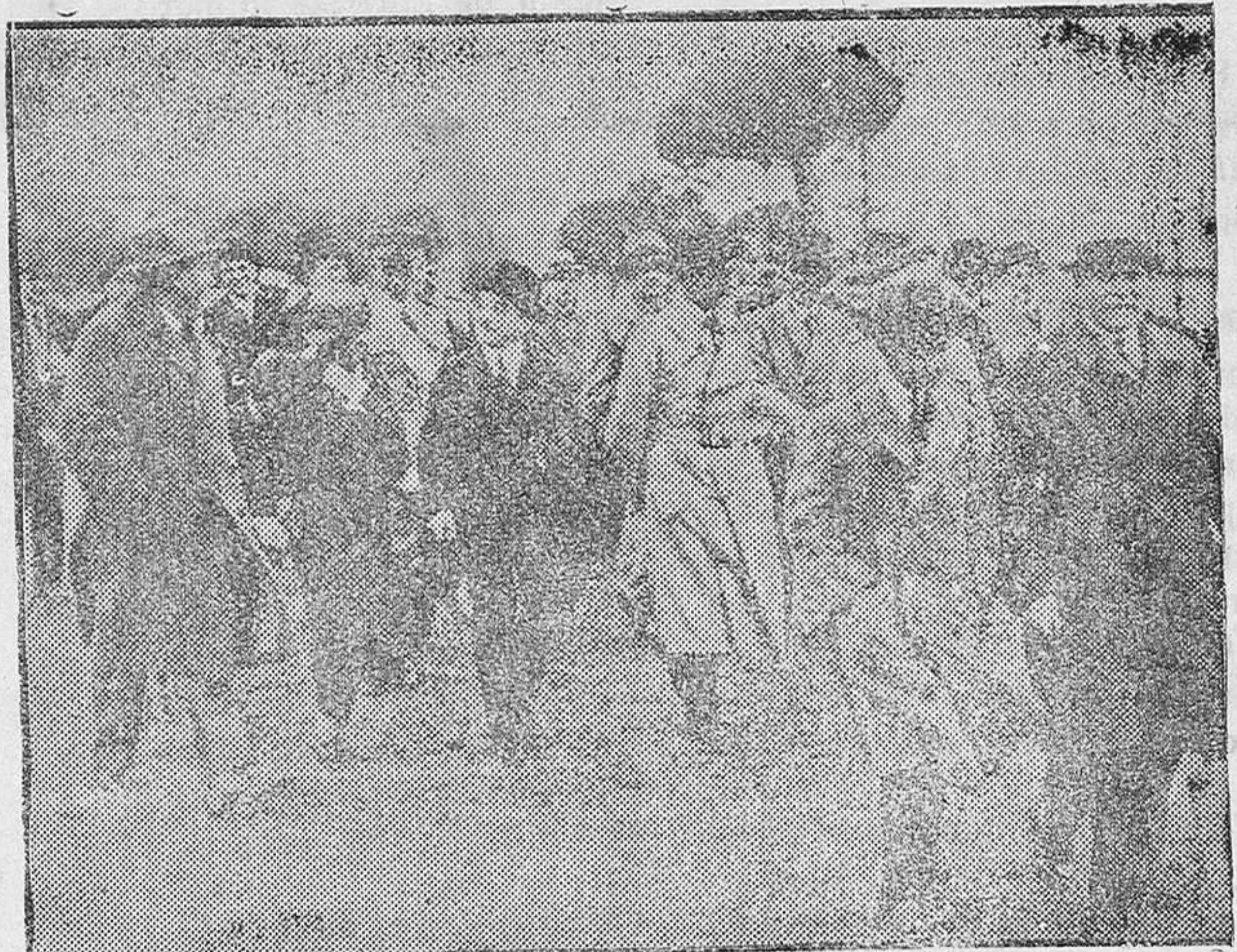
ROMA.—He aquí a los señores Mussolati, Dollfus y Goembels, con los Reyes de Italia al entrar en el Hipódromo para presenciar el concurso hípico