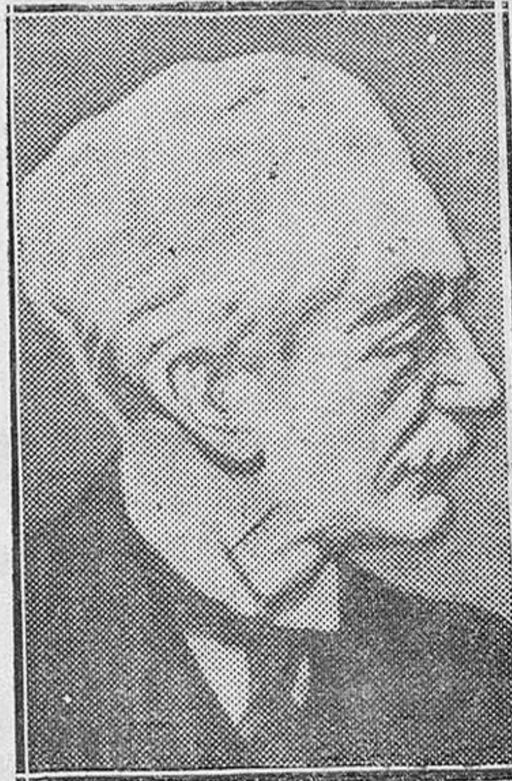
Paul Hymans, ministro belga de Negocios Extranjeros, con quien su colega francés Luis Barthou conferenció en Bruselas sobre el problema del desarme