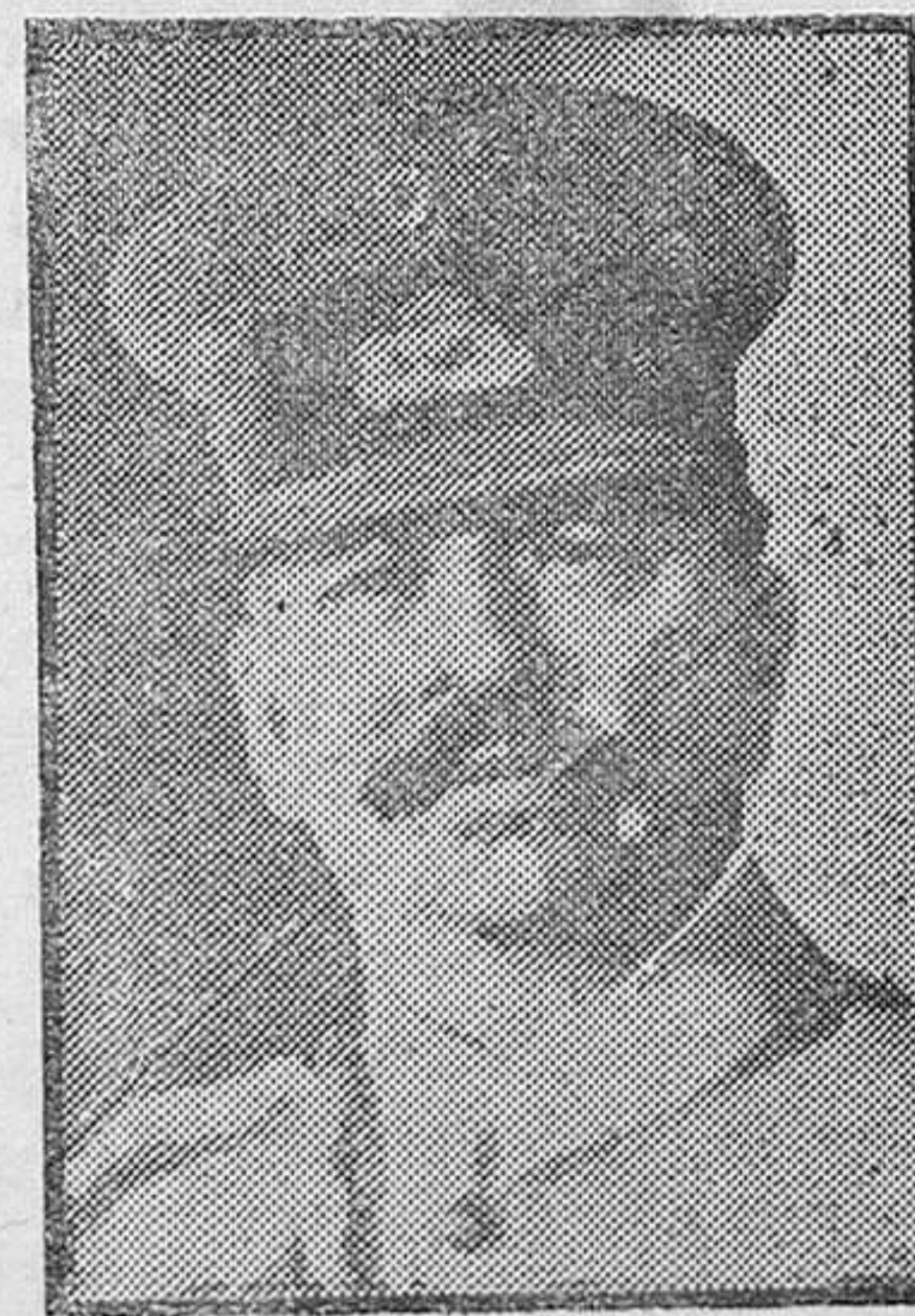
El general Gómez, que se encuentra enfermo de gravedad