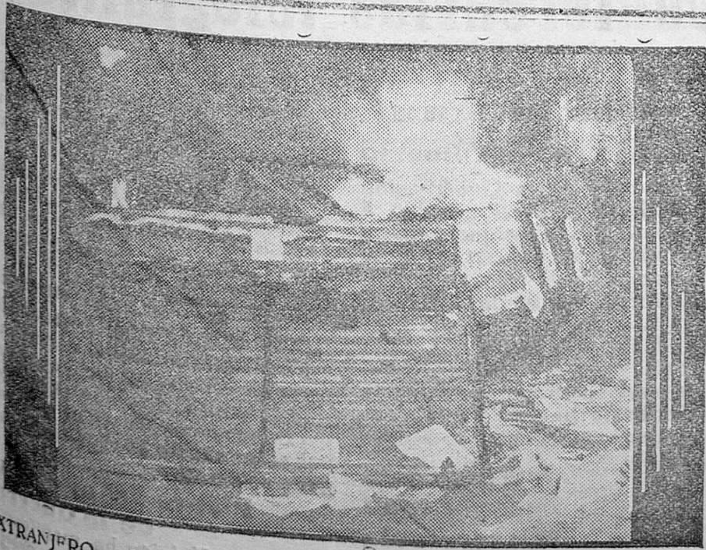
EXTRANJERO. — París. — Alrededor del asunto Stavisky, se han quemado kioscos de periódicos y vehículos