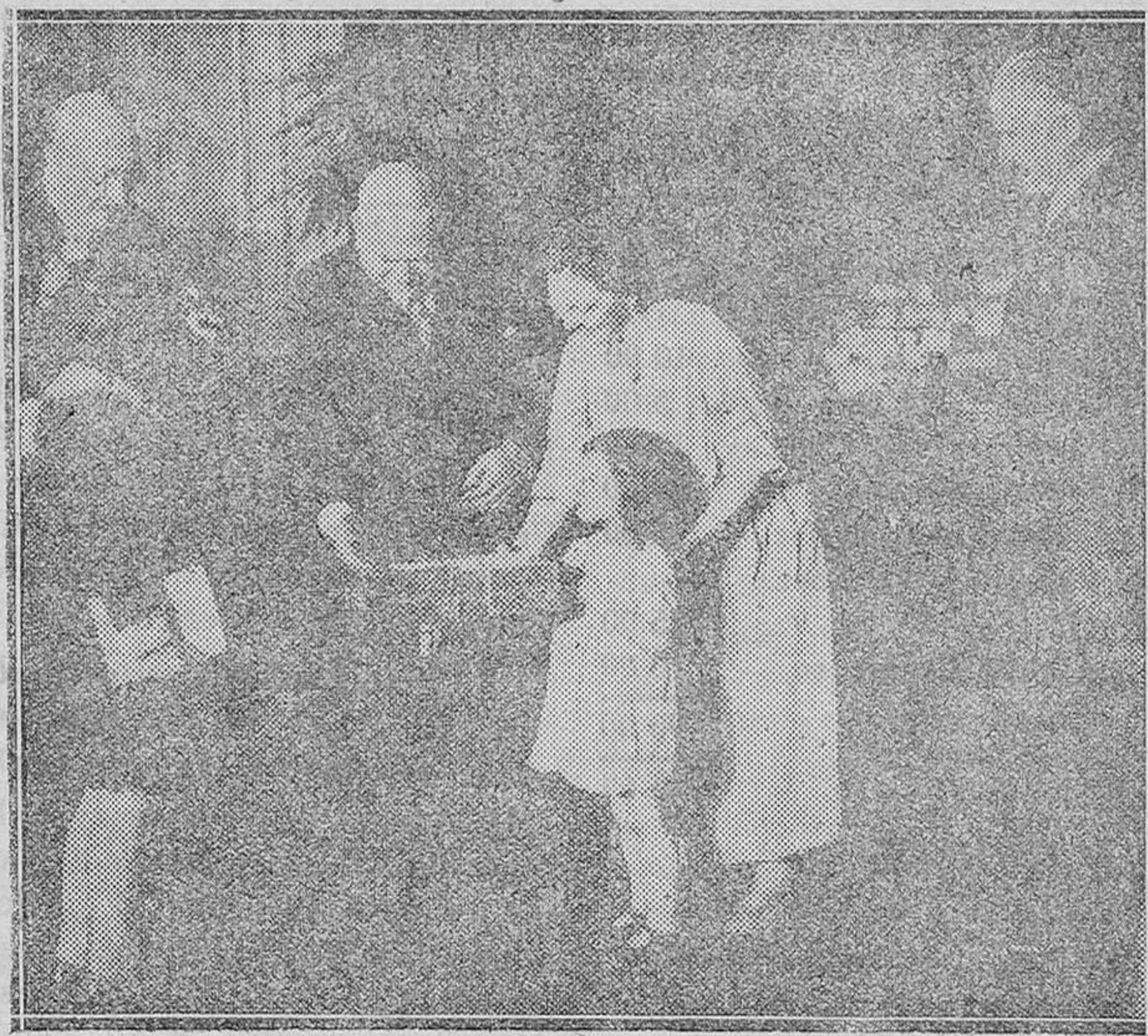
PARIS.—El Presidente de la República francesa, durante el acto del reparto de juguetes a los niños pobres, con motivo de las fiestas tradicionales de Navidad