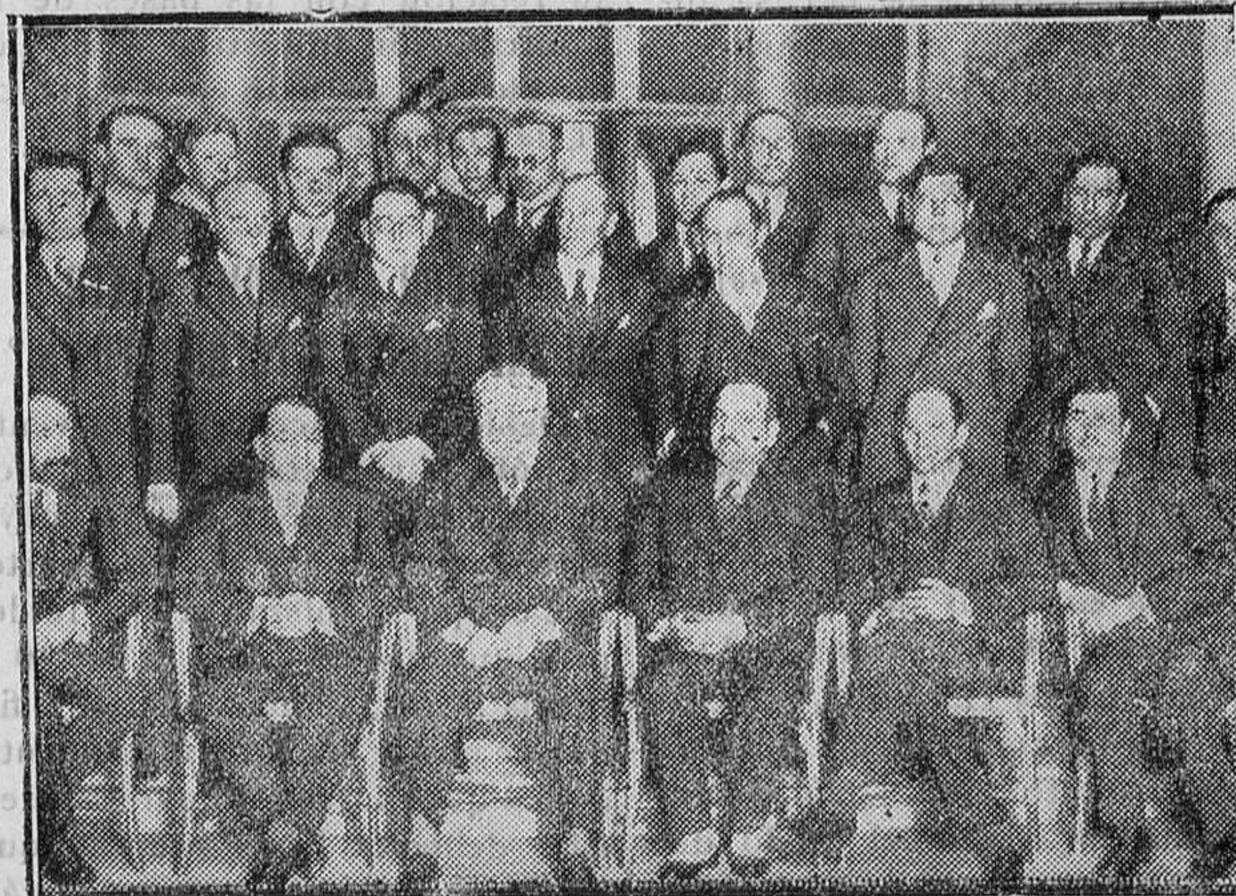
MADRID.—Banquete que dieron los periodistas extranjeros al Jefe del Gobierno don Manuel Azaña