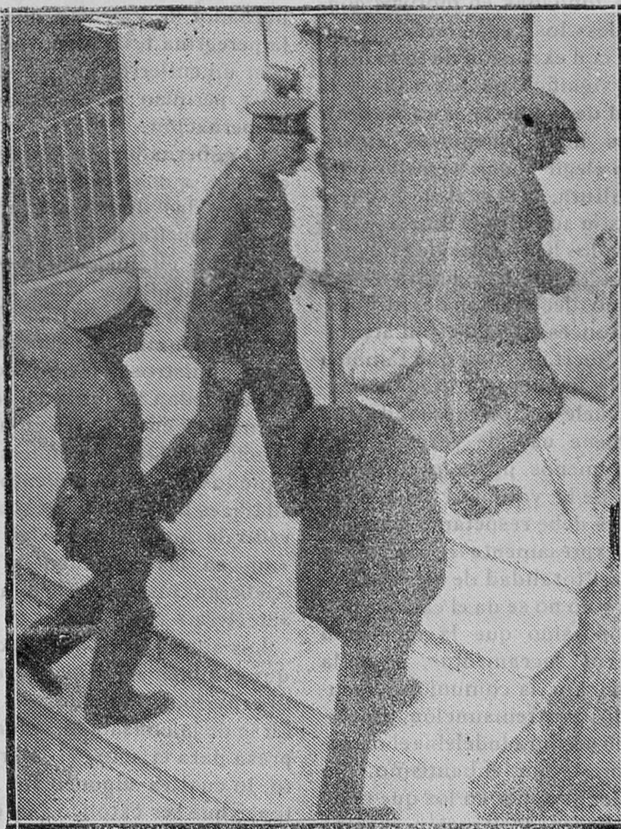
TARRASA (Barcelona).—El asesino del niño de 3 meses y que lo mató chupándole la sangre.—En la foto al ser conducido por los agentes de la autoridad