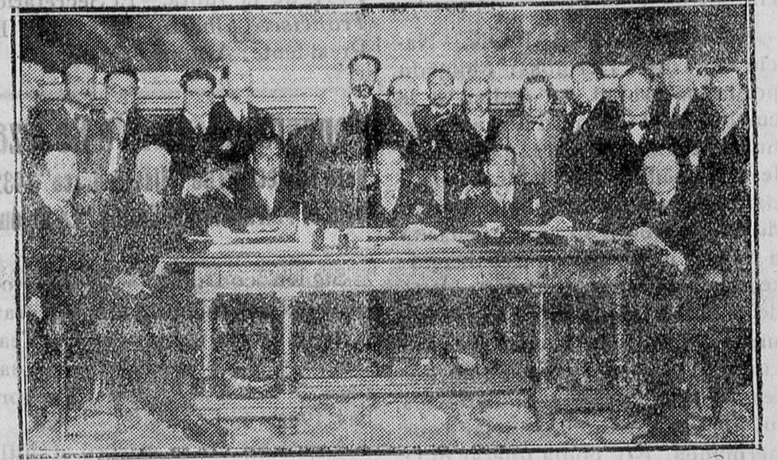
MADRID.—El Estatuto Catalán.—Reunión de la minoría catalana en el Congreso para tratar del próximo debate del dictamen relacionado con dicho asunto

Con el título «Vidas Extraordinarias» acaba de iniciarse la publicación de una serie biográfica que ha de despertar la curiosidad de todos los países de habla castellana, de manera análoga a la de «Vidas Españolas e Hispanoamericanas del siglo XIX», comenzada hace dos años, la cual tan rápida acogida mereció. Ambas series vienen a completarse, constituyendo un conjunto biográfico amplio y armónico que irá ofreciendo la exposición enjuiciadora de valores personales eminentes, conjunto agrupado en esos dos órdenes de referencia, o sea el del pasado próximo de la raza, y el otro, más ecléctico, de todos los países y épocas que destacaron con caracteres de singular celebridad.