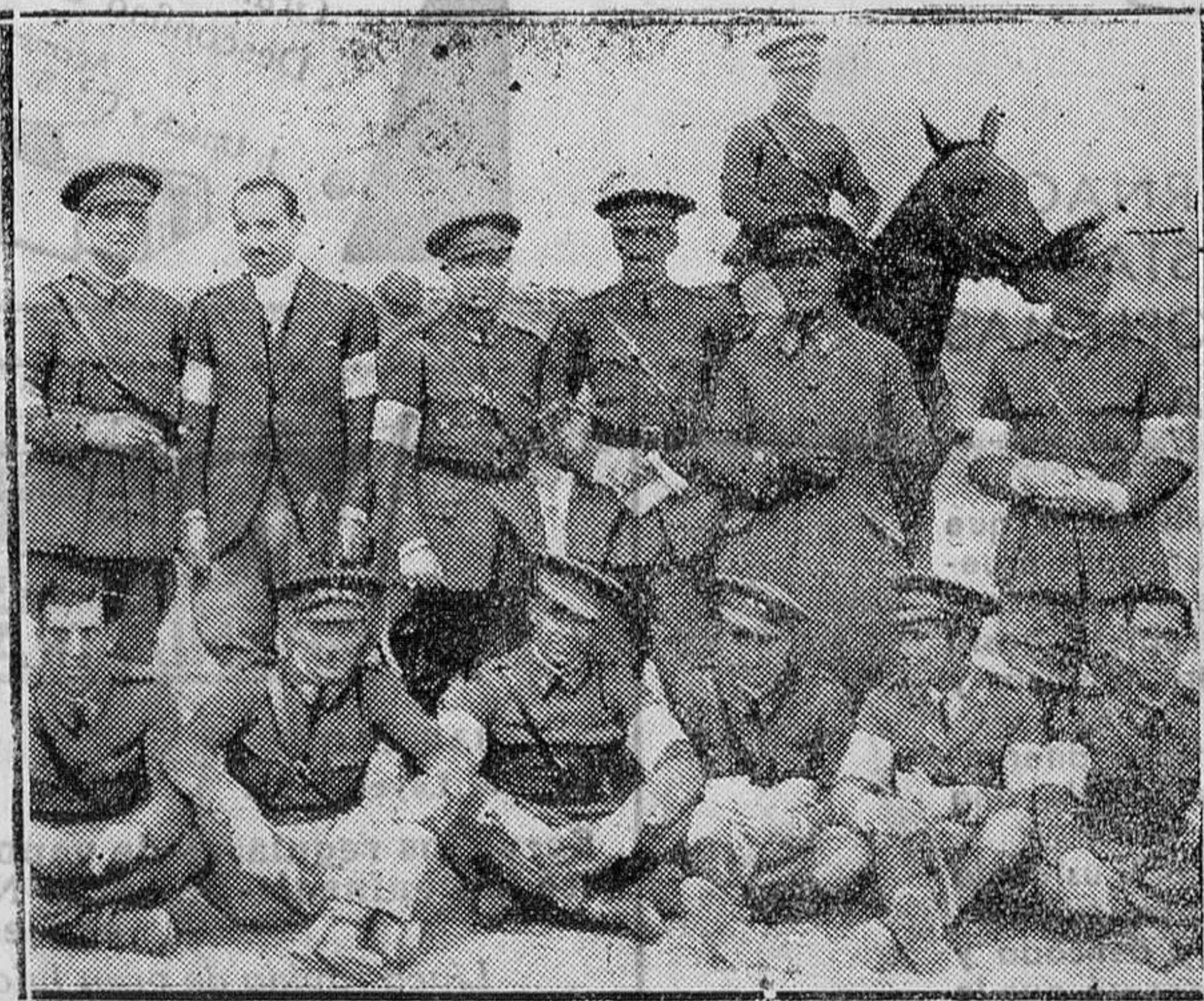
MADRID.—Grupo de jinetes que han tomado parte en el Campeonato de caballos de armas, celebrado en Carabanchel

Lo está una casa y cochera en el camino de Lluernas con siete cercados, establo, boyera y árboles frutales; y en Mahón las casas calle Cos de Gracia números 47-49 y 53-55-57. Informes: Buenaire, 31. 2-5-1 mi v